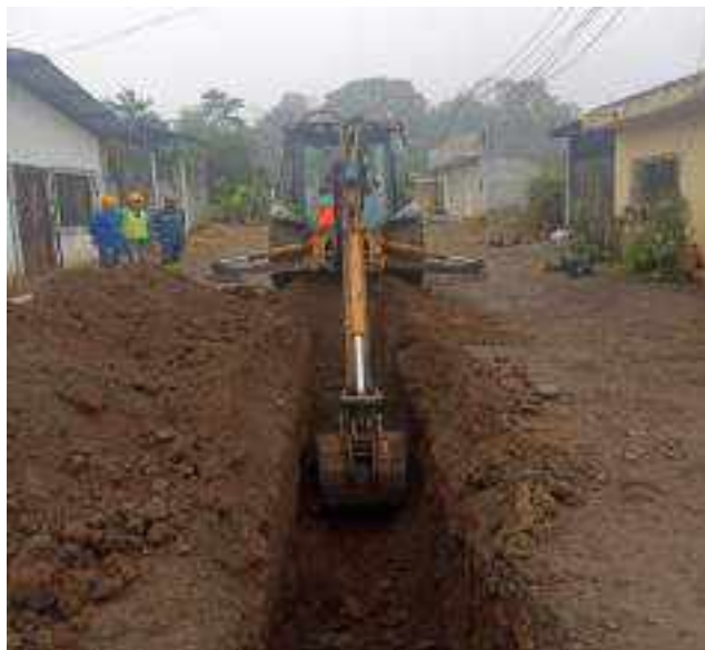
12 JULIO – 2022. EXCAVACION POR EXTENSION DE RED DE ALCANTARILLADO SANITARIO, CALLE BALTAZAR CURILLO Y FRANCISCO CHAVEZ