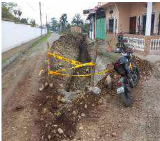
15 DICIEMBRE – 2022. RELLENO POR CAMBIO DE RED DE ALCANTARILLADO SANITARIO, CALLE; CALLEJON DEL OLEODUCTO Y MANUEL CAHUANA.