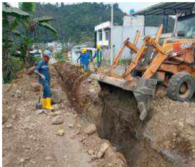
31 AGOSTO – 2022. RELLENO Y LIMPIEZA POR EXTENSION DE RED DE ALCANTARILLADO SANITARIO, CALLE EDMUNDO CUADRADO ENTRE 4 DE DICIEMBRE Y ATAHUALPA