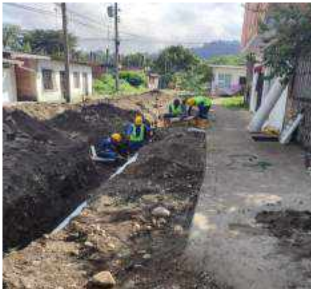
27 JUNIO – 2022. EXCAVACIÓN POR CAMBIO DE TUBERIA DE ALCANTARILLADO SANITARIO, CALLE DIGNO ESPINOZA ENTRE 9 DE OCTUBRE Y SIMON BOLIVAR