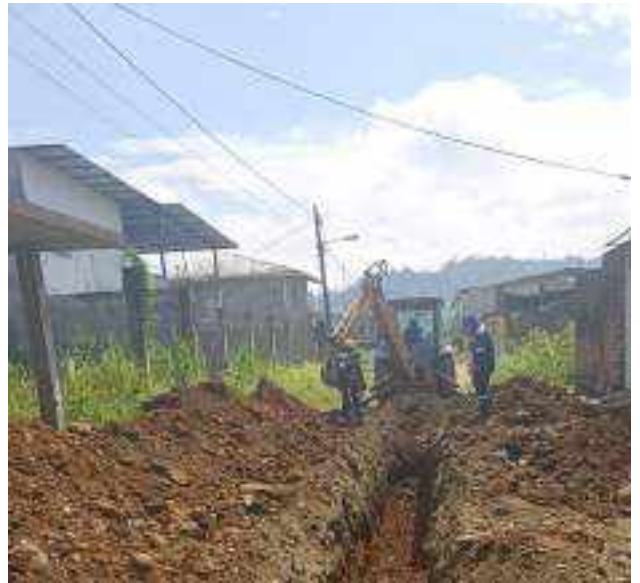
16 JUNIO - 2022. EXCAVACIÓN POR EXTENSION DE TUBERIA DE ALCANTARILLADO SANITARIO, CALLE MANUEL CAGUANA ENTRE CESAR CALVOPIÑA Y PASAJE A