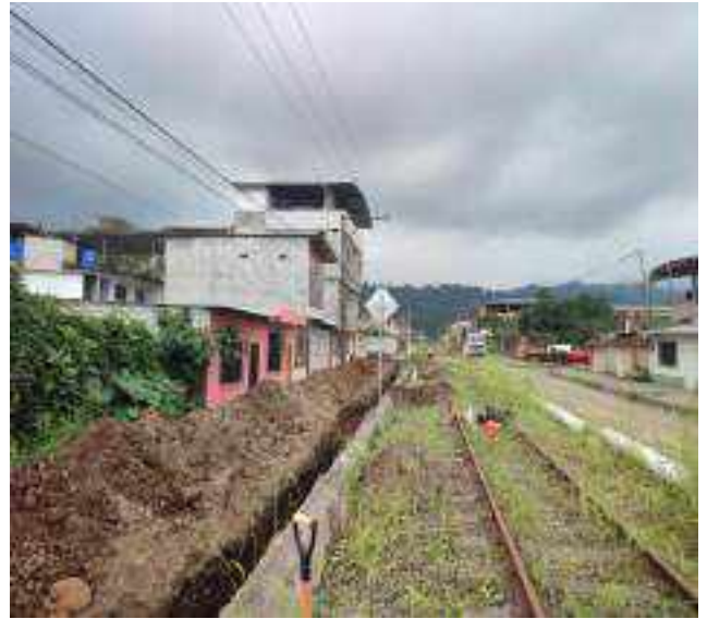
6 JUNIO – 2022. EXCAVACIÓN POR EXTENSION DE TUBERIA DE ALCANTARILLADO SANITARIO, CALLE ELOY ALFARO ENTRE MATEO MAQUISACA Y CELINDA MUÑOZ