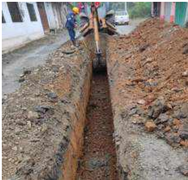
13 JUNIO - 2022. EXCAVACIÓN POR EXTENSION DE TUBERIA DE ALCANTARILLADO SANITARIO, CALLE MANUEL CARCHI ENTRE CESAR CALVOPIÑA Y PERIMETRAL