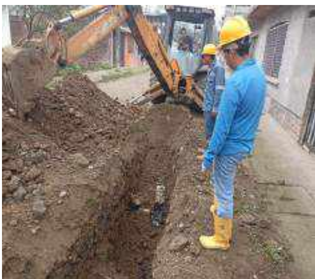
12 DICIEMBRE – 2022. EXCAVACION POR CAMBIO DE RED DE ALCANTARILLADO SANITARIO, CALLE; PASAJE 1 ENTRE PRIMERA CONSTITUYENTE Y ABDON CALDERON.