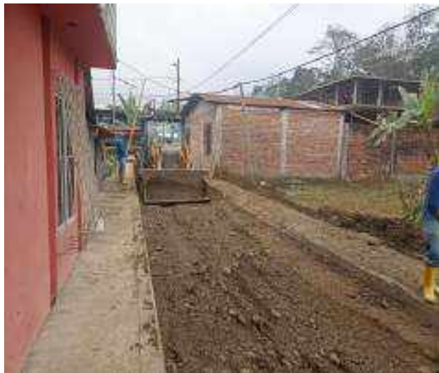
23 DICIEMBRE – 2022. RELLENO POR CAMBIO DE RED DE ALCANTARILLADO SANITARIO, CALLE; PASAJE 1 ENTRE PRIMERA CONSTITUYENTE Y ABDON CALDERON.