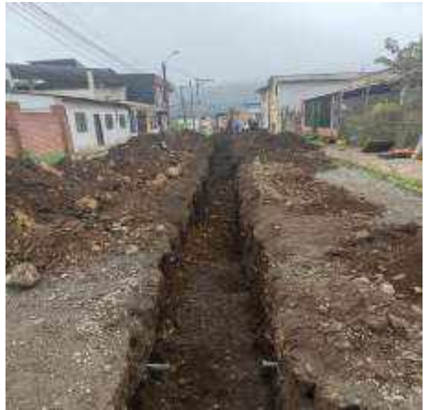
9 JUNIO – 2022. EXCAVACIÓN POR CAMBIO DE TUBERIA DE ALCANTARILLADO SANITARIO, CALLE MANUEL CARCHI ENTRE JAIME CABRERA Y 10 DE AGOSTO