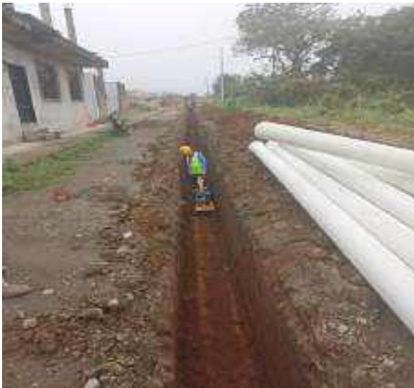
7 JUNIO – 2022. EXCAVACIÓN POR EXTENSION DE TUBERIA DE ALCANTARILLADO SANITARIO, CALLE EUGENIO ESPEJO ENTRE PERIMETRAL Y CESAR CALVOPIÑA