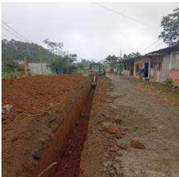
18 JULIO – 2022. EXCAVACIÓN POR EXTENSION DE RED DE ALCANTARILLADO SANITARIO, CALLE FRANCISCO CHAVEZ ENTRE MANUEL CAGUANA Y MANUEL CHILUIZA