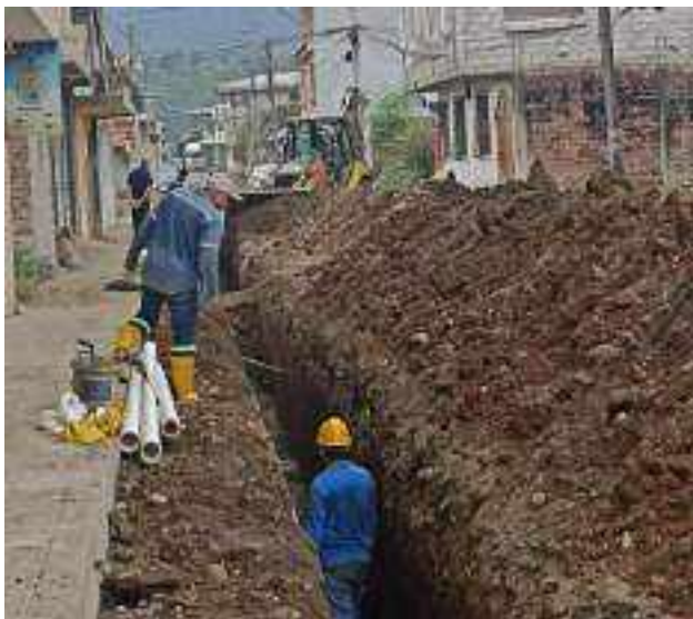
7 DICIEMBRE – 2022. EXCAVACION POR CAMBIO DE RED DE ALCANTARILLADO SANITARIO, CALLE; ABDON CALDERON ENTRE PASAJE 1 Y FRANCISCO CHAVEZ.