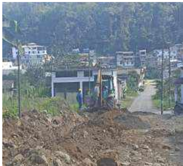
19 AGOSTO – 2022. RELLENO POR EXTENSION DE RED DE ALCANTARILLADO SANITARIO, CALLE 28 DE ENERO ENTRE 4 DE DICIEMBRE Y TALUD