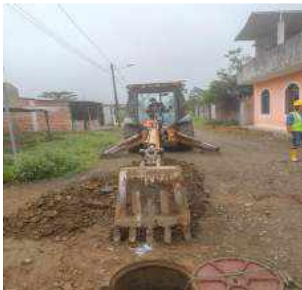
4 JULIO – 2022. EXCAVACIÓN POR CAMBIO DE TUBERIA DE ALCANTARILLADO SANITARIO, CALLE MANUEL CAGUANA ENTRE MATEO MAQUISACA Y CELINDA MUÑOZ