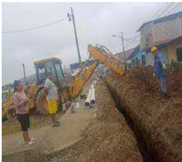
28 OCTUBRE – 2022. EXCAVACION POR CAMBIO DE RED DE ALCANTARILLADO SANITARIO, CALLE; ABDON CALDERON ENTRE PASAJE 2 Y CESAR CALVOPIÑA.