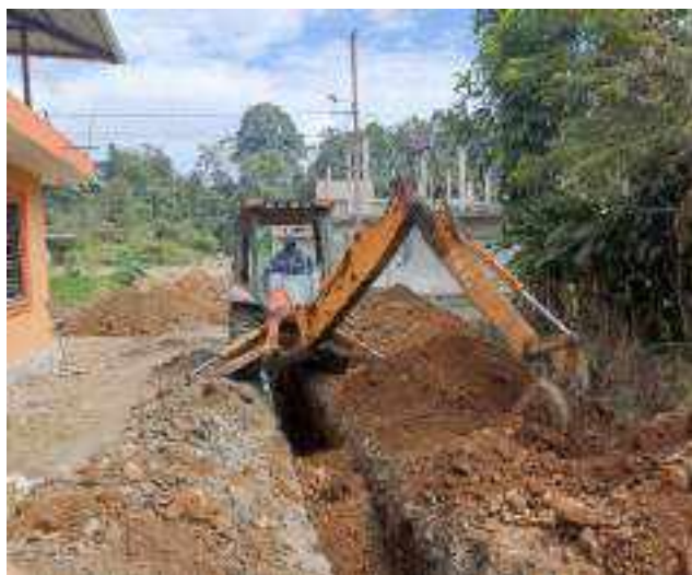
4 AGOSTO – 2022. EXCAVACION POR EXTENSION DE RED DE ALCANTARILLADO SANITARIO, CALLE SEGUNDO MERINO ENTRE CELINDA MUÑOZ Y FRANCISCO CHAVEZ