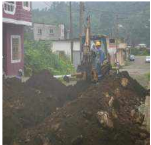
9 JUNIO – 2022. EXCAVACIÓN POR CAMBIO DE TUBERIA DE ALCANTARILLADO SANITARIO, CALLE MANUEL CARCHI ENTRE JAIME CABRERA Y 10 DE AGOSTO