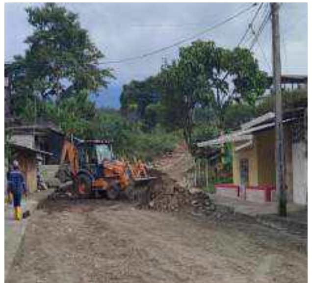
28 JUNIO – 2022. RELLENO DE ZANJA POR CAMBIO DE TUBERIA DE ALCANTARILLADO SANITARIO, CALLE DIGNO ESPINOZA ENTRE 9 DE OCTUBRE Y SIMON BOLIVAR