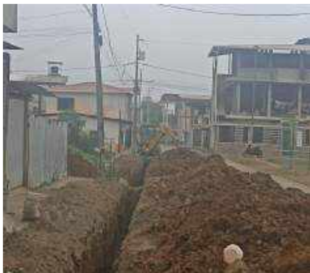
16 NOVIEMBRE – 2022. EXCAVACION POR CAMBIO DE RED DE ALCANTARILLADO SANITARIO, CALLE; CESAR CALVOPIÑA ENTRE 24 DE MAYO Y CALLEJON PEATONAL.