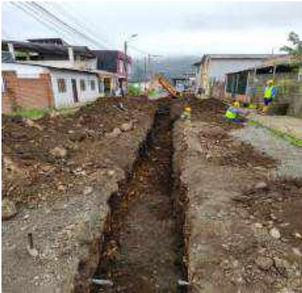
9 JUNIO – 2022. EXCAVACIÓN POR CAMBIO DE TUBERIA DE ALCANTARILLADO SANITARIO, CALLE MANUEL CARCHI ENTRE JAIME CABRERA Y 10 DE AGOSTO