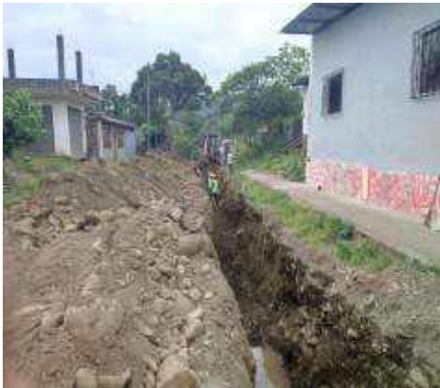
29 JUNIO – 2022. EXCAVACIÓN POR CAMBIO DE TUBERIA DE ALCANTARILLADO SANITARIO, CALLE DIGNO ESPINOZA ENTRE SIMON BOLIVAR Y OLEODUCTO