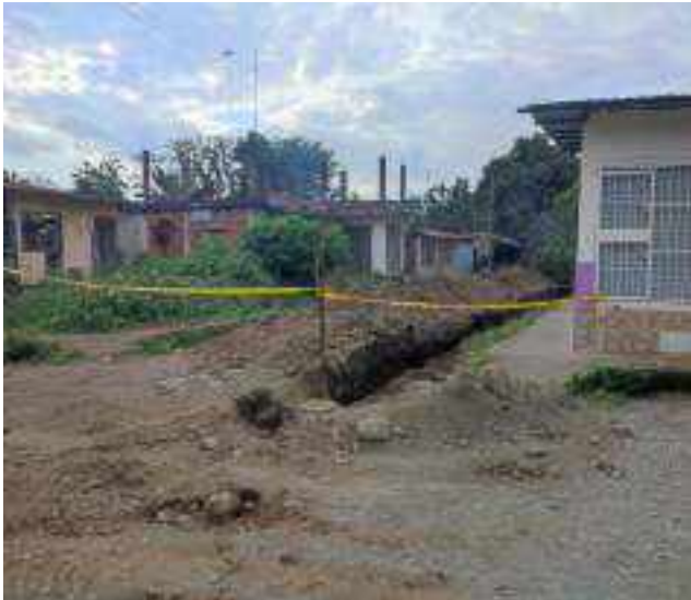
29 JUNIO – 2022. EXCAVACIÓN POR CAMBIO DE TUBERIA DE ALCANTARILLADO SANITARIO, CALLE DIGNO ESPINOZA ENTRE SIMON BOLIVAR Y OLEODUCTO