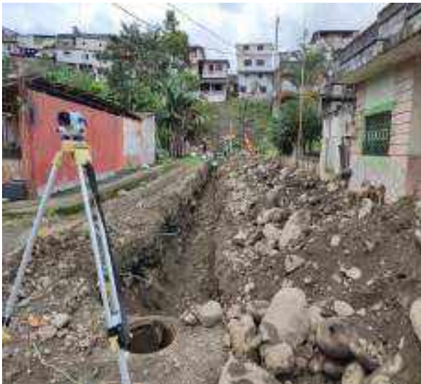
14 JUNIO – 2022. EXCAVACIÓN POR CAMBIO DE TUBERIA DE ALCANTARILLADO SANITARIO, CALLE 24 DE MAYO ENTRE EDMUNDO VILLACRES Y PASAJE