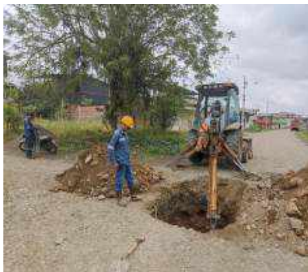
29 AGOSTO – 2022. EXCAVACION Y RELLENO DE POZOS POR EXTENSION DE RED DE ALCANTARILLADO SANITARIO, CALLE MARTIN ORTEGA Y CRISTOBAL COLON