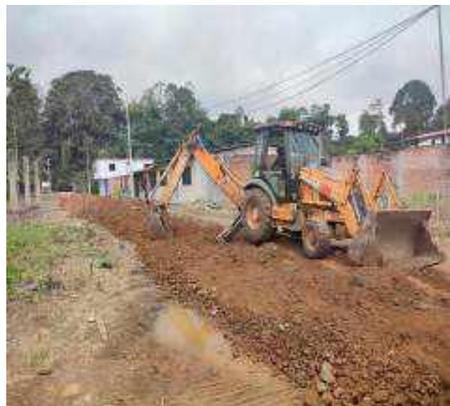
29 JULIO - 2022. RELLENO POR EXTENSION DE RED DE ALCANTARILLADO SANITARIO, CALLE BALTAZAR CURILLO ENTRE CESAR CALVOPIÑA Y FRANCISCO CHAVEZ