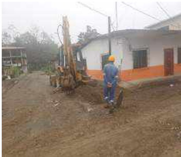
21 NOVIEMBRE – 2022. EXCAVACION POR CAMBIO DE RED DE ALCANTARILLADO SANITARIO, CALLE; 24 DE MAYO ENTRE CESAR CALVOPIÑA Y PASAJE 3.