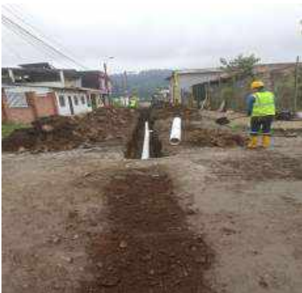
9 JUNIO – 2022. EXCAVACIÓN POR CAMBIO DE TUBERIA DE ALCANTARILLADO SANITARIO, CALLE MANUEL CARCHI ENTRE JAIME CABRERA Y 10 DE AGOSTO