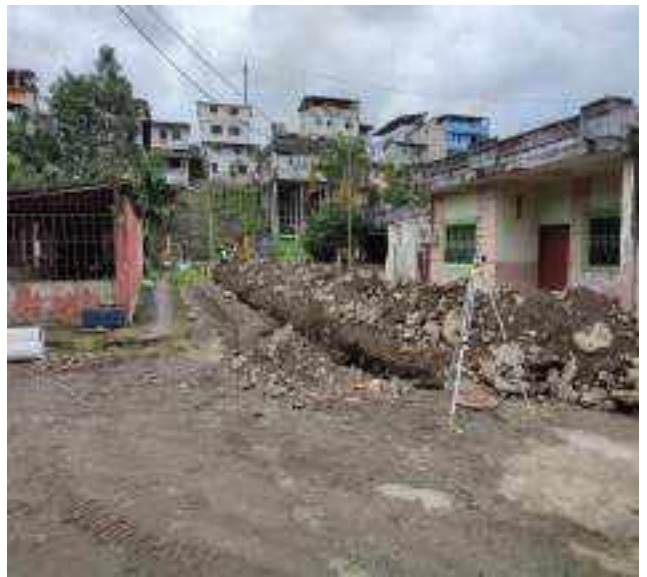
14 JUNIO – 2022. EXCAVACIÓN POR CAMBIO DE TUBERIA DE ALCANTARILLADO SANITARIO, CALLE 24 DE MAYO ENTRE EDMUNDO VILLACRES Y PASAJE