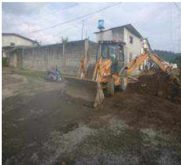
10 JUNIO – 2022. RELLENO DE ZANJA POR EXTENSION Y CAMBIO DE TUBERIA DE ALCANTARILLADO SANITARIO, CALLE MANUEL CARCHI ENTRE JRICARDO ESPINOZA Y 10 DE AGOSTO