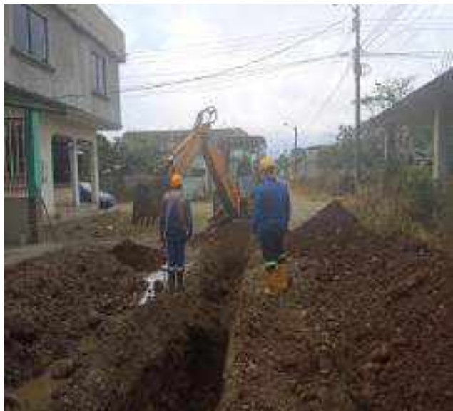
7 JULIO – 2022. EXCAVACIÓN POR CAMBIO DE TUBERIA DE ALCANTARILLADO SANITARIO, CALLE CELINDA MUÑOZ ENTRE MANUEL CAGUANA Y BALTAZAR CURILLO