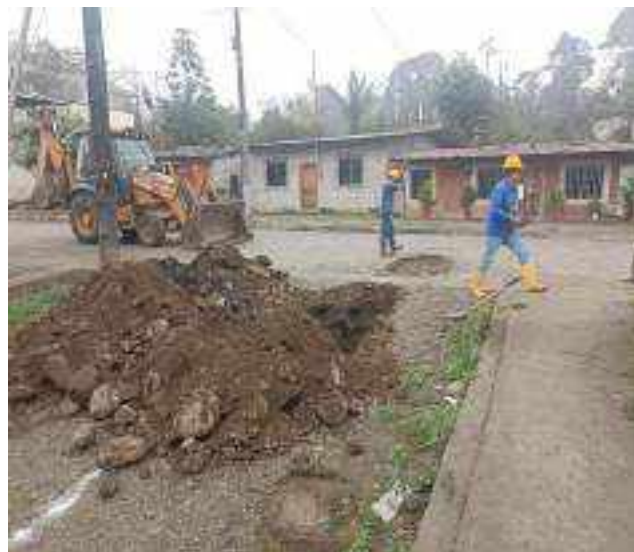
28 SEPTIEMBRE – 2022. EXCAVACION POR CAMBIO DE RED DE ALCANTARILLADO SANITARIO, CALLE MIGUEL ANDRADE ENTRE PASAJE D Y 4 DE DICIEMBRE