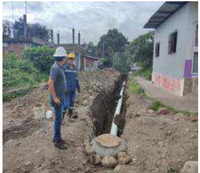
29 JUNIO – 2022. EXCAVACIÓN POR CAMBIO DE TUBERIA DE ALCANTARILLADO SANITARIO, CALLE DIGNO ESPINOZA ENTRE SIMON BOLIVAR Y OLEODUCTO