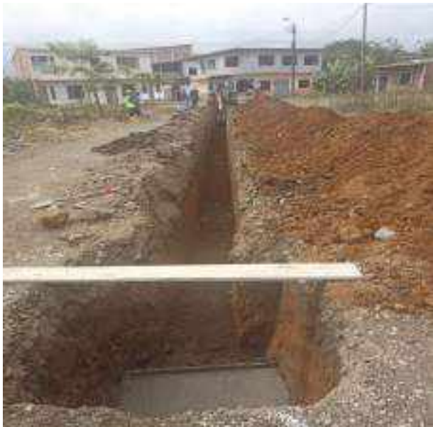
13 JULIO – 2022. EXCAVACIÓN POR EXTENSION DE RED DE ALCANTARILLADO SANITARIO, CALLE FRANCISCO CHAVEZ ENTRE MANUEL CARCHI Y BALTAZAR CURILLO