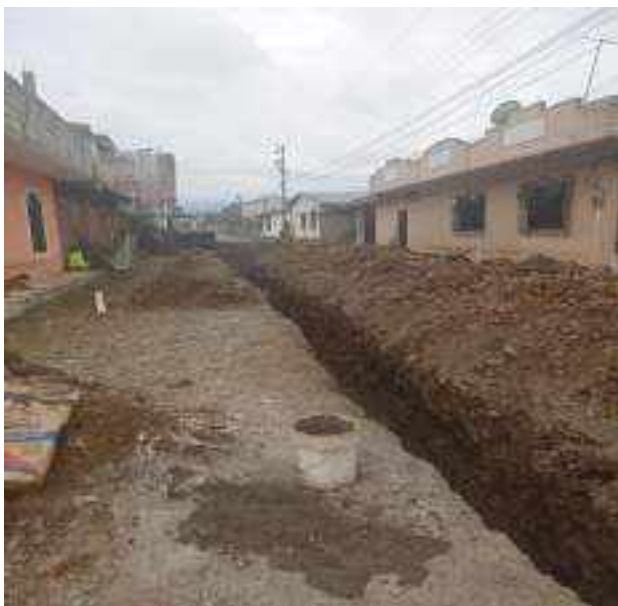
5 JULIO – 2022. EXCAVACIÓN POR CAMBIO DE TUBERIA DE ALCANTARILLADO SANITARIO, CALLE CELINDA MUÑOZ ENTRE MANUEL CAGUANA Y BALTAZAR CURILLO