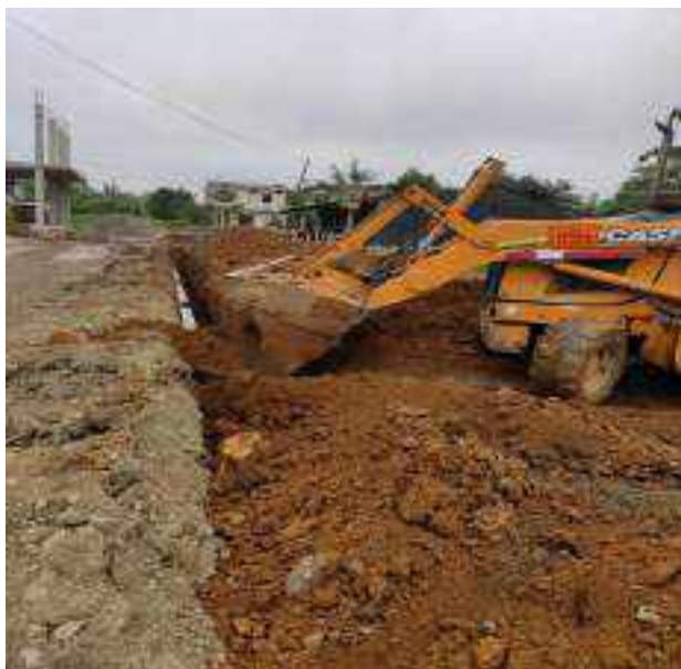
15 JULIO – 2022. RELLENO POR EXTENSION DE RED DE ALCANTARILLADO SANITARIO, CALLE FRANCISCO CHAVEZ ENTRE MANUEL CARCHI Y BALTAZAR CURILLO