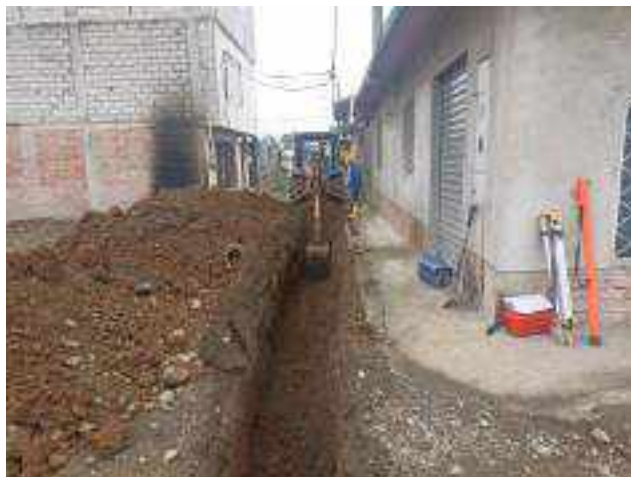
20 DICIEMBRE – 2022. EXCAVACION POR CAMBIO DE RED DE ALCANTARILLADO SANITARIO, CALLE; CALLEJON DEL OLEODUCTO Y MANUEL CAHUANA.