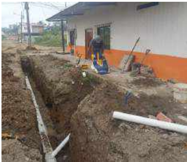
29 NOVIEMBRE – 2022. EXCAVACION POR CAMBIO DE RED DE ALCANTARILLADO SANITARIO, CALLE; CELINDA MUÑOZ ENTRE PRIMERA CONSTITUYENTE Y ABDON CALDERON.