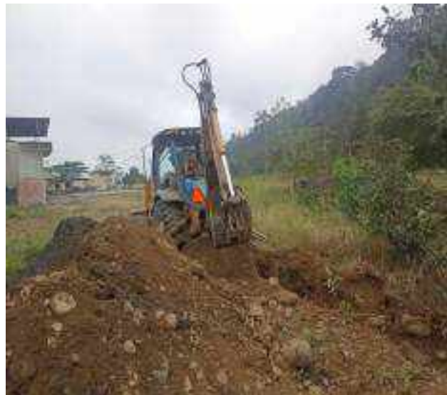
26 SEPTIEMBRE – 2022. EXCAVACION POR CAMBIO DE RED DE ALCANTARILLADO SANITARIO, CALLE CALLEJON A ENTRE TRANSVERSAL A Y MIGUEL ANDRADE