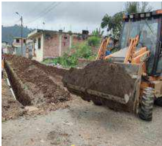
7 SEPTIEMBRE – 2022. RELLENO POR EXTENSION DE RED DE ALCANTARILLADO SANITARIO, CALLE CRISTOBAL COLON ENTRE EDMUNDO CUADRADO Y MARIO NARANJO