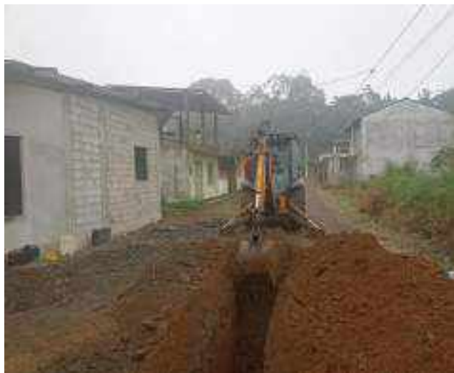
1 AGOSTO – 2022. EXCAVACION POR EXTENSION DE RED DE ALCANTARILLADO SANITARIO, CALLE MANUEL CAGUANA ENTRE PASAJE A Y FRANCISCO CHAVEZ