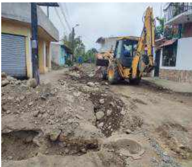
6 OCTUBRE – 2022. LIMPIEZA DE CALLE POR CAMBIO DE RED DE ALCANTARILLADO SANITARIO, CALLE; ATAHUALPA ENTRE TRANSVERSAL A Y MIGUEL ANDRADE.