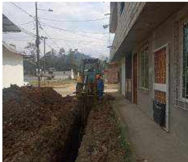
14 DICIEMBRE – 2022. EXCAVACION POR CAMBIO DE RED DE ALCANTARILLADO SANITARIO, CALLE; CALLEJON DEL OLEODUCTO Y MANUEL CAHUANA.