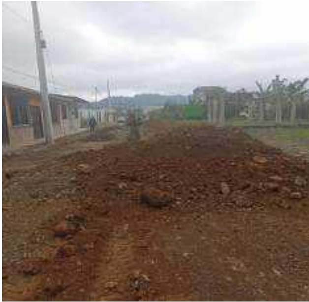
29 JULIO - 2022. RELLENO POR EXTENSION DE RED DE ALCANTARILLADO SANITARIO, CALLE BALTAZAR CURILLO ENTRE CESAR CALVOPIÑA Y FRANCISCO CHAVEZ