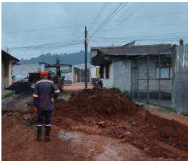
13 SEPTIEMBRE – 2022. LIMPIEZA DE CALLES POR EXTENSION DE RED DE ALCANTARILLADO SANITARIO, CALLE EDMUNDO CUADRADO ENTRE ATAHUALPA Y CRISTOBAL COLON