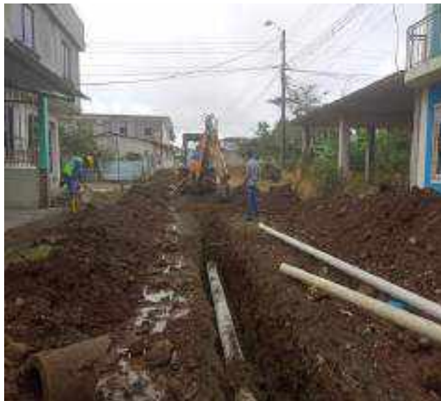
8 JULIO – 2022. RELLENO POR CAMBIO DE RED DE ALCANTARILLADO SANITARIO, CALLE CELINDA MUÑOZ ENTRE MANUEL CARCHI Y BALTAZAR CURILLO.