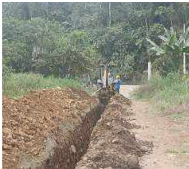
8 AGOSTO – 2022. EXCAVACION POR EXTENSION DE RED DE ALCANTARILLADO SANITARIO, CALLE SEGUNDO MERINO ENTRE PERIMETRAL Y FRANCISCO CHAVEZ