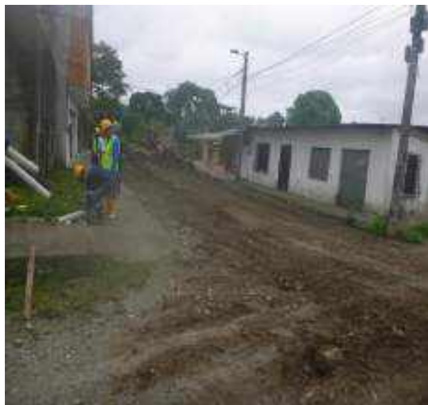
17 JUNIO – 2022. RETIRO DE MATERIAL POR CAMBIO Y EXTENSION DE RED DE ALCANTARILLADO SANITARIO, CALLES EDMUNDO VILLACRES, MANUEL CAGUANA Y CESAR CALVOPIÑA