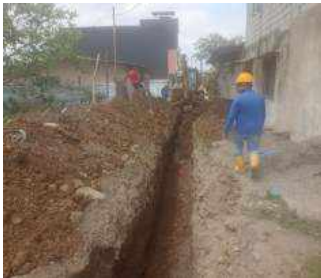
13 DICIEMBRE – 2022. RELLENO POR CAMBIO DE RED DE ALCANTARILLADO SANITARIO, CALLE; PASAJE 1 ENTRE PRIMERA CONSTITUYENTE Y ABDON CALDERON.