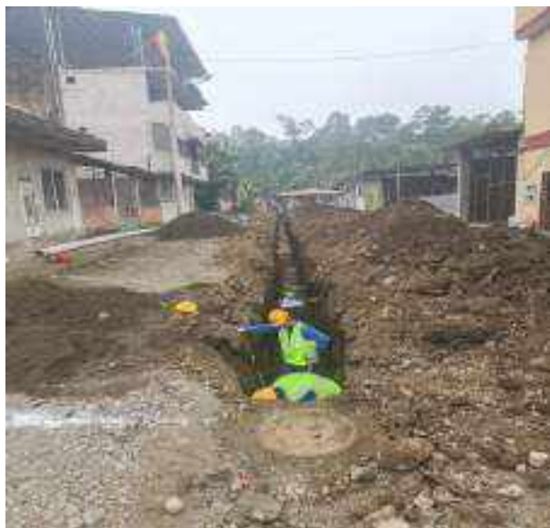
1 JUNIO – 2022. EXCAVACIÓN POR CAMBIO DE TUBERIA DE ALCANTARILLADO SANITARIO, CALLE MATEO MAQUISACA ENTRE 28 DE ENERO Y RUMIÑAHUI