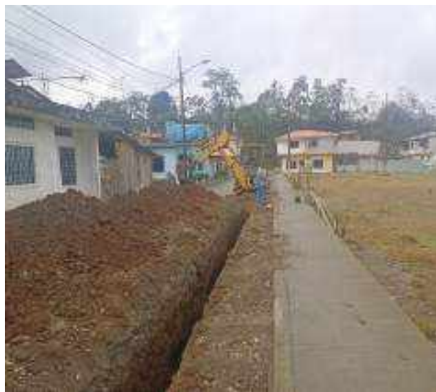
27 OCTUBRE – 2022. RELLENO POR CAMBIO DE RED DE ALCANTARILLADO SANITARIO, CALLE; ABDON CALDERON ENTRE FRANCISCO CHAVEZ Y PASAJE 2.