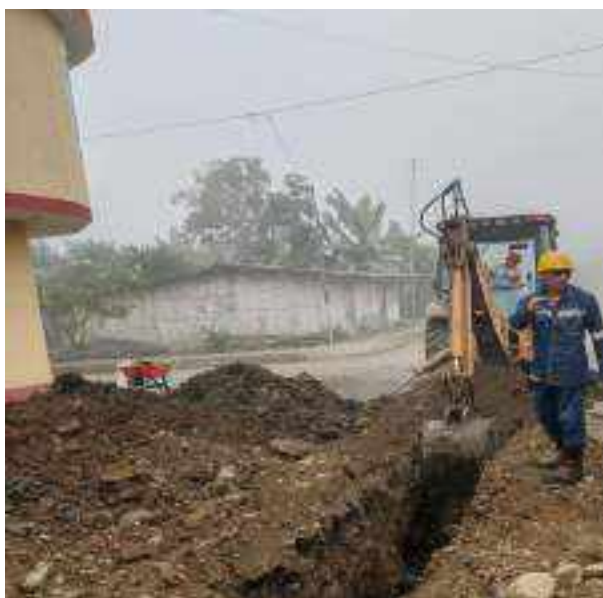
1 JUNIO – 2022. EXCAVACIÓN POR CAMBIO DE TUBERIA DE ALCANTARILLADO SANITARIO, CALLE MATEO MAQUISACA ENTRE 28 DE ENERO Y RUMIÑAHUI