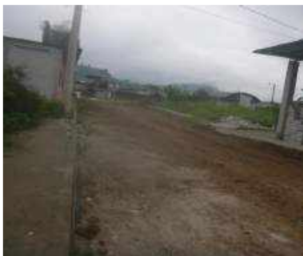
10 JUNIO – 2022. RELLENO DE ZANJA POR EXTENSION Y CAMBIO DE TUBERIA DE ALCANTARILLADO SANITARIO, CALLE MANUEL CARCHI ENTRE JRICARDO ESPINOZA Y 10 DE AGOSTO