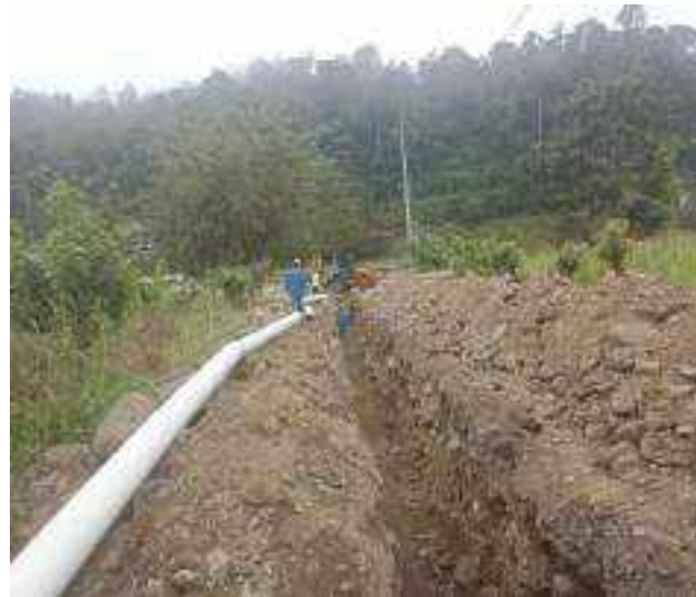
12 SEPTIEMBRE – 2022. RELLENO POR EXTENSION DE RED DE ALCANTARILLADO SANITARIO, CALLE EDMUNDO CUADRADO ENTRE ATAHUALPA Y CRISTOBAL COLON