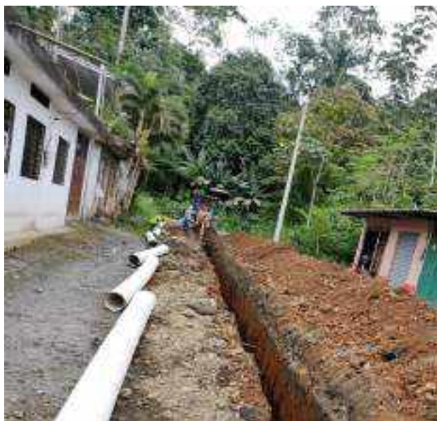
13 JUNIO - 2022. EXCAVACIÓN POR EXTENSION DE TUBERIA DE ALCANTARILLADO SANITARIO, CALLE MANUEL CARCHI ENTRE CESAR CALVOPIÑA Y PERIMETRAL