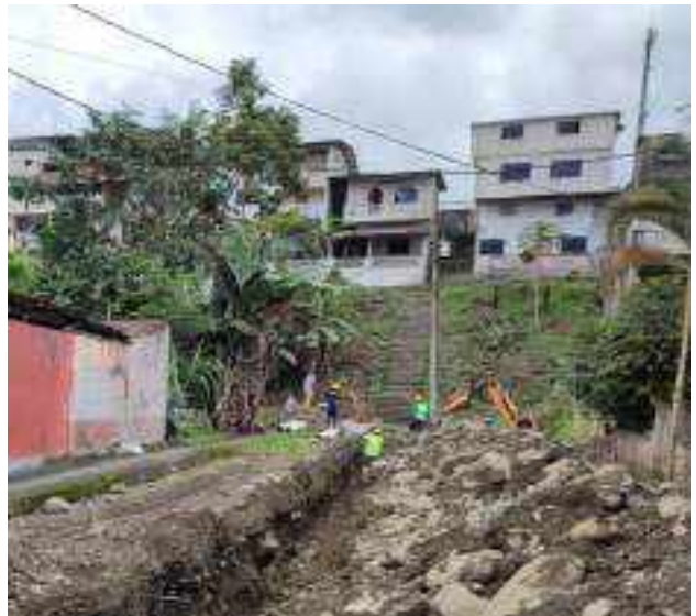
14 JUNIO – 2022. EXCAVACIÓN POR CAMBIO DE TUBERIA DE ALCANTARILLADO SANITARIO, CALLE 24 DE MAYO ENTRE EDMUNDO VILLACRES Y PASAJE