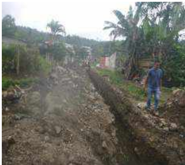
15 JUNIO – 2022. EXCAVACIÓN POR CAMBIO DE TUBERIA DE ALCANTARILLADO SANITARIO, CALLE 24 DE MAYO PASAJE Y CRISTOBAL COLON