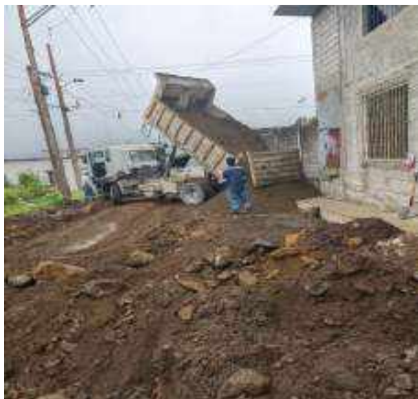
10 JUNIO – 2022. RELLENO DE ZANJA POR EXTENSION Y CAMBIO DE TUBERIA DE ALCANTARILLADO SANITARIO, CALLE MANUEL CARCHI ENTRE JRICARDO ESPINOZA Y 10 DE AGOSTO