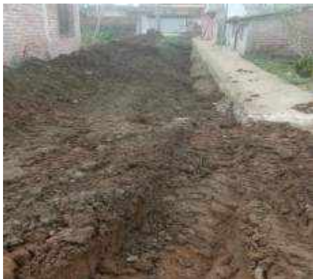
28 DICIEMBRE – 2022. RELLENO EXCAVACION POR CAMBIO DE RED DE ALCANTARILLADO SANITARIO, CALLE; PASAJE 3 ENTRE PRIMERA CONSTITUYENTE Y ABDON CALDERON.