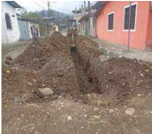
8 DICIEMBRE – 2022. EXCAVACION POR CAMBIO DE RED DE ALCANTARILLADO SANITARIO, CALLE; 24 DE MAYO ENTRE CELINDA MUÑOZ Y FRANCISCO CHAVEZ.