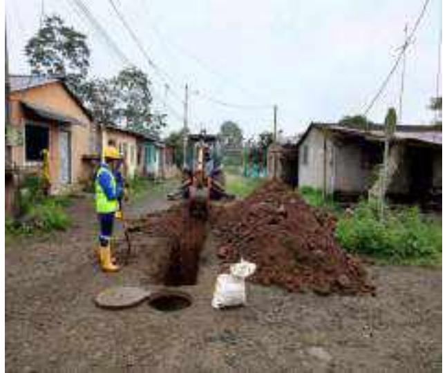
30 JUNIO – 2022. EXCAVACIÓN POR EXTENSION DE TUBERIA DE ALCANTARILLADO SANITARIO, CALLE CELINDA MUÑOZ ENTRE MANUEL CAGUANA Y MANUEL CHILUIZA