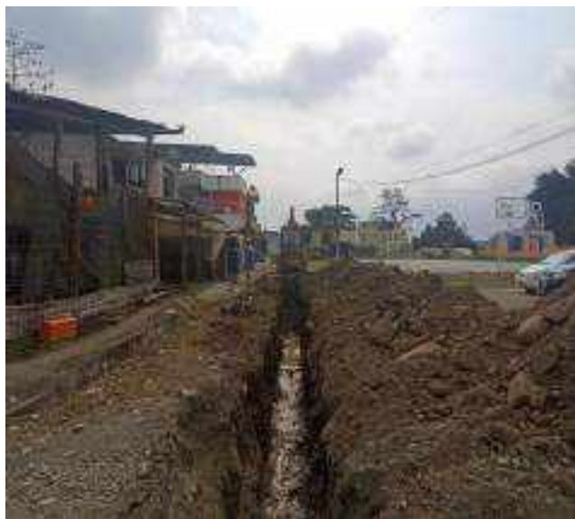
12 OCTUBRE – 2022. EXCAVACION POR CAMBIO DE RED DE ALCANTARILLADO SANITARIO, CALLE; CALLEJON A Y MIGUEL ANDRADE.