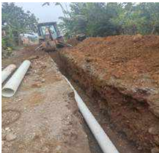
22 JULIO – 2022. EXCAVACIÓN POR EXTENSION DE RED DE ALCANTARILLADO SANITARIO, CALLE TRANSVERSAL 6 ENTRE FRANCISCO CHAVEZ Y CELINDA MUÑOZ.