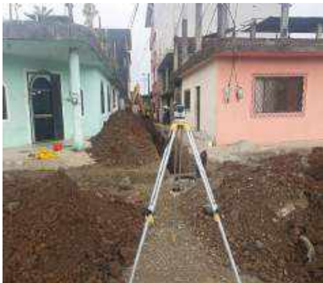
11 NOVIEMBRE – 2022. LIMPIEZA POR CAMBIO DE RED DE ALCANTARILLADO SANITARIO, CALLE; 24 DE MAYO ENTRE PASAJE 2 Y CESAR CALVOPIÑA