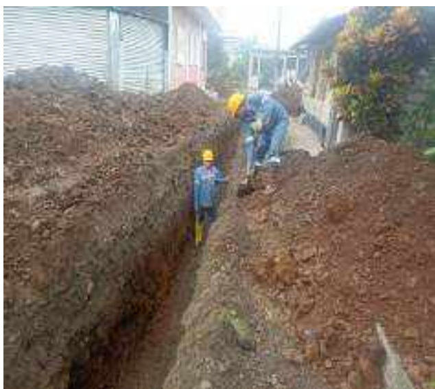
16 DICIEMBRE – 2022. LIMPIEZA POR CAMBIO DE RED DE ALCANTARILLADO SANITARIO, CALLE; CALLEJON DEL OLEODUCTO Y MANUEL CAHUANA.