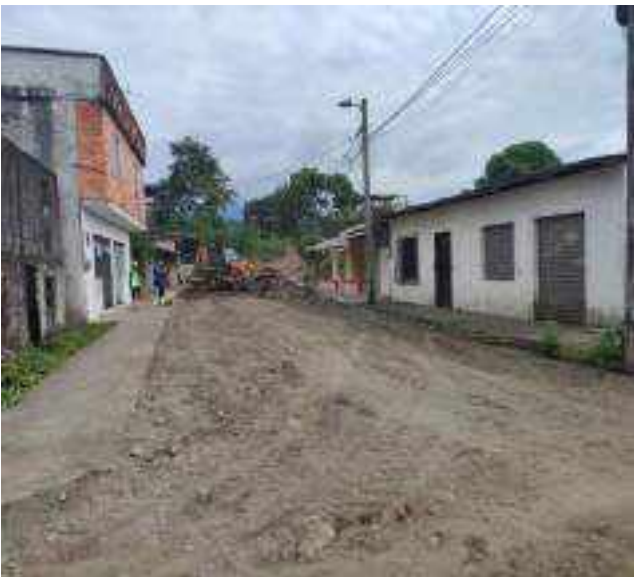
28 JUNIO – 2022. RELLENO DE ZANJA POR CAMBIO DE TUBERIA DE ALCANTARILLADO SANITARIO, CALLE DIGNO ESPINOZA ENTRE 9 DE OCTUBRE Y SIMON BOLIVAR