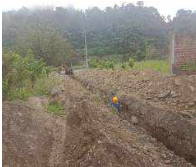
9 SEPTIEMBRE – 2022. RELLENO POR EXTENSION DE RED DE ALCANTARILLADO SANITARIO, CALLE EDMUNDO CUADRADO ENTRE ATAHUALPA Y CRISTOBAL COLON