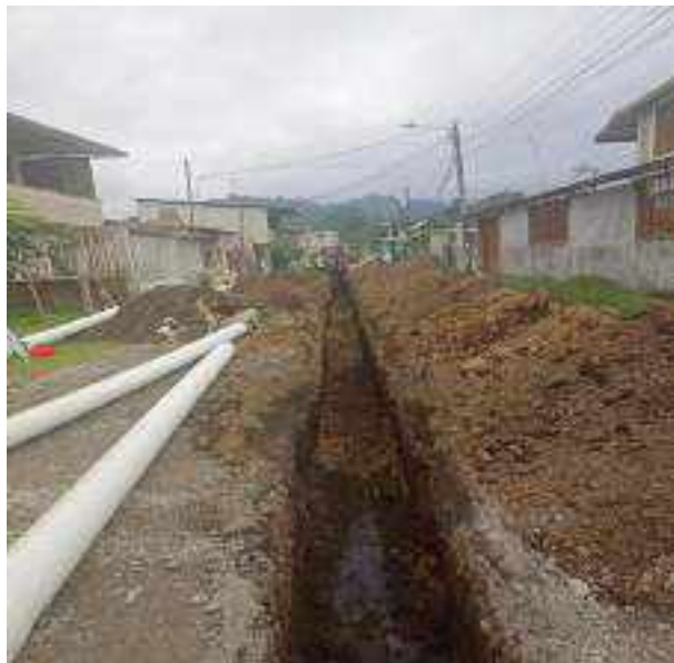
8 JUNIO – 2022. EXCAVACIÓN POR EXTENSION DE TUBERIA DE ALCANTARILLADO SANITARIO, CALLE MANUEL CARCHI ENTRE JAIME CABRERA Y RICARDO ESPINOZA