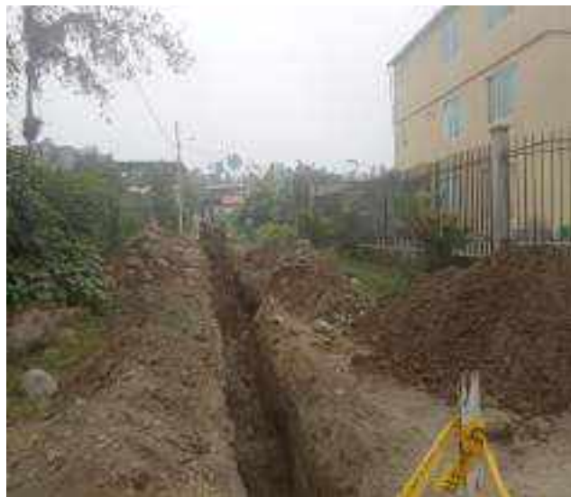
14 SEPTIEMBRE – 2022. EXCAVACION POR EXTENSION DE RED DE ALCANTARILLADO SANITARIO, CALLE MARTIN ORTEGA ENTRE ATAHUALPA Y CRISTOBAL COLON