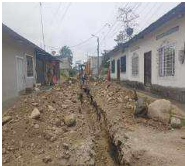
7 OCTUBRE – 2022. EXCAVACION POR CAMBIO DE RED DE ALCANTARILLADO SANITARIO, CALLE; ATAHUALPA ENTRE MIGUEL ANDRADE Y PASAJE C.