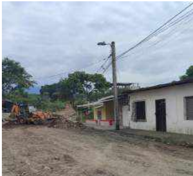
17 JUNIO – 2022. RETIRO DE MATERIAL POR CAMBIO Y EXTENSION DE RED DE ALCANTARILLADO SANITARIO, CALLES EDMUNDO VILLACRES, MANUEL CAGUANA Y CESAR CALVOPIÑA