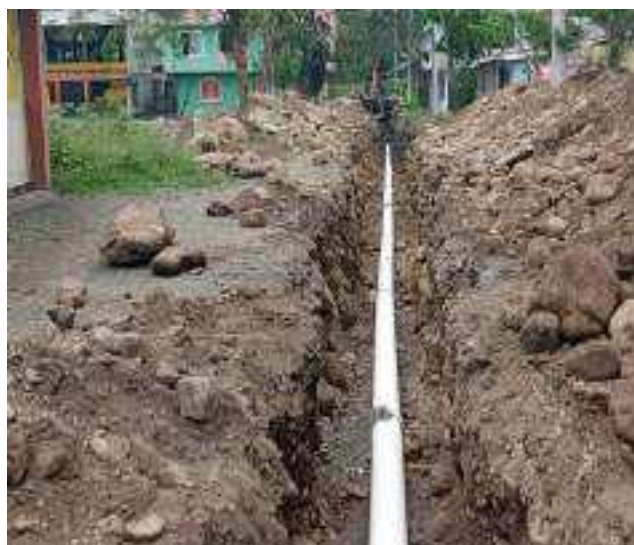
31 AGOSTO – 2022. RELLENO Y LIMPIEZA POR EXTENSION DE RED DE ALCANTARILLADO SANITARIO, CALLE EDMUNDO CUADRADO ENTRE 4 DE DICIEMBRE Y ATAHUALPA