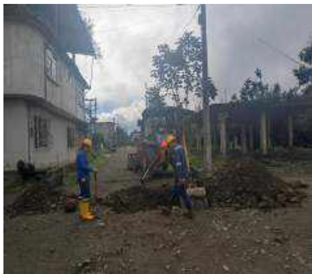
26 AGOSTO – 2022. EXCAVACION POR EXTENSION DE RED DE ALCANTARILLADO SANITARIO, CALLE EDMUNDO CUADRADO ENTRE 4 DE DICIEMBRE Y ATAHUALPA