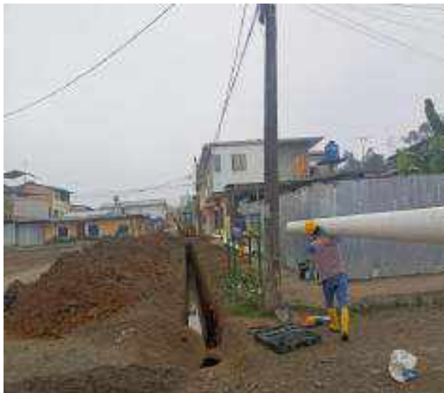
15 NOVIEMBRE – 2022. RELLENO POR CAMBIO DE RED DE ALCANTARILLADO SANITARIO, CALLE; CESAR CALVOPIÑA ENTRE CALLEJON PEATONAL Y ABDON CALDERON.