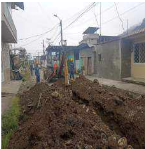
30 SEPTIEMBRE – 2022. EXCAVACION POR CAMBIO DE RED DE ALCANTARILLADO SANITARIO, CALLE ATAHUALPA ENTRE TRASNVERSAL A Y MIGUEL ANDRADE