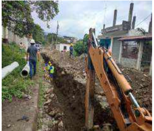
29 JUNIO – 2022. EXCAVACIÓN POR CAMBIO DE TUBERIA DE ALCANTARILLADO SANITARIO, CALLE DIGNO ESPINOZA ENTRE SIMON BOLIVAR Y OLEODUCTO