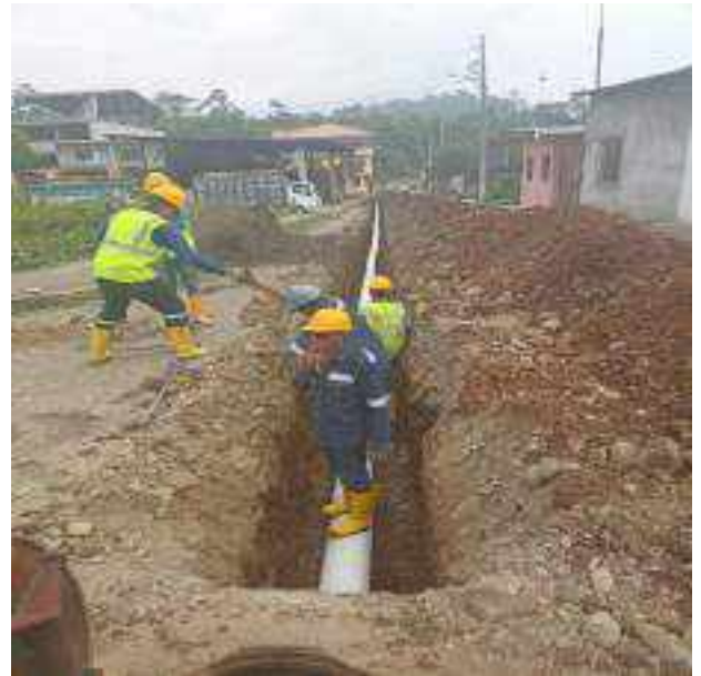
2 JUNIO – 2022. EXCAVACIÓN POR EXTENSION DE TUBERIA DE ALCANTARILLADO SANITARIO, CALLE RUMIÑAHUI ENTRE MATEO MAQUISACA Y RICARDO ESPINOZA