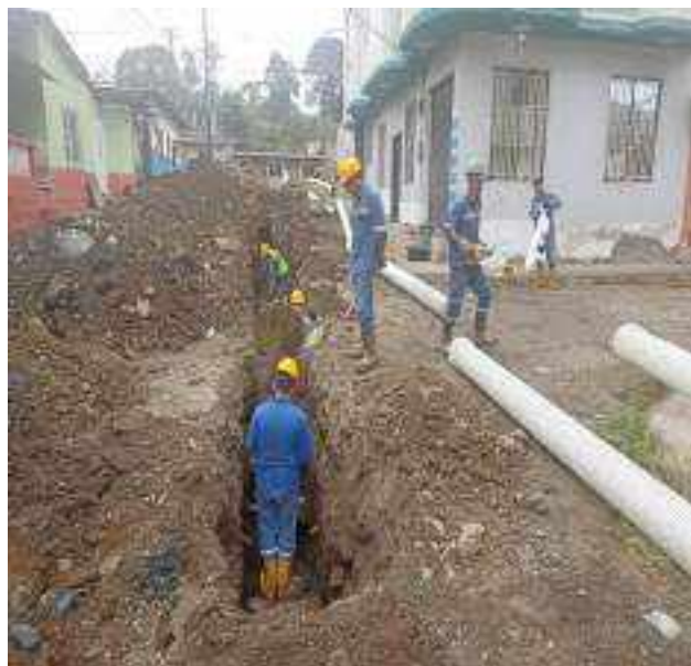
29 SEPTIEMBRE – 2022. EXCAVACION POR CAMBIO DE RED DE ALCANTARILLADO SANITARIO, CALLE MIGUEL ANDRADE ENTRE PASAJE D Y ATAHUALPA