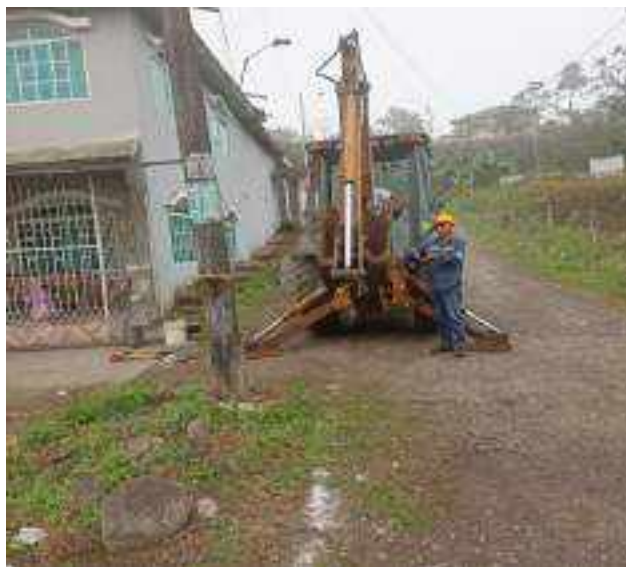
15 AGOSTO – 2022. EXCAVACION POR EXTENSION DE RED DE ALCANTARILLADO SANITARIO, CALLE 28 DE ENERO ENTRE 4 DE DICIEMBRE Y TALUD