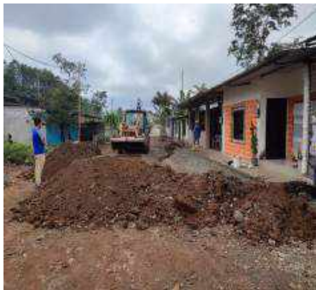
23 AGOSTO – 2022. LIMPIEZA DE CALLES EN EL SECTOR DIVINO NIÑO, SE CULMINA