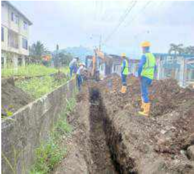
6 JUNIO – 2022. EXCAVACIÓN POR EXTENSION DE TUBERIA DE ALCANTARILLADO SANITARIO, CALLE ELOY ALFARO ENTRE MATEO MAQUISACA Y CELINDA MUÑOZ