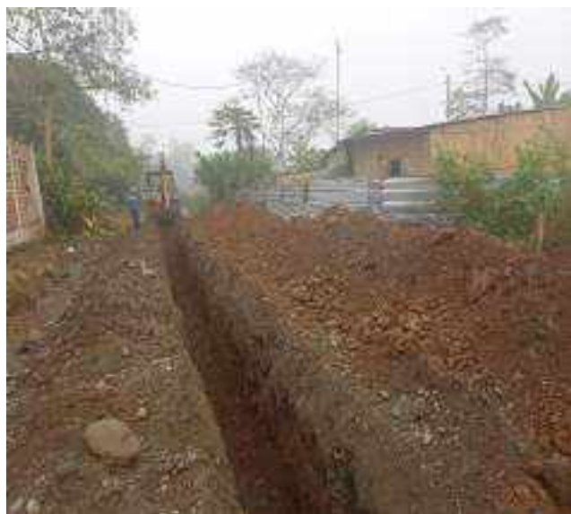
27 JULIO – 2022. RELLENO POR EXTENSION DE RED DE ALCANTARILLADO SANITARIO, CALLE CELINDA MUÑOZ ENTRE SEGUNDO MERINO Y FLAVIO MARTINEZ