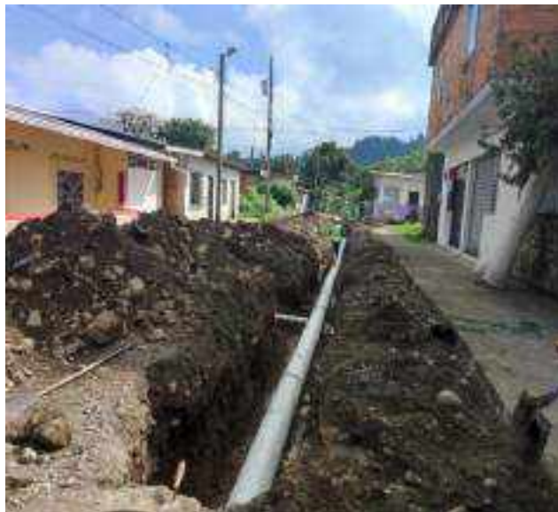
27 JUNIO – 2022. EXCAVACIÓN POR CAMBIO DE TUBERIA DE ALCANTARILLADO SANITARIO, CALLE DIGNO ESPINOZA ENTRE 9 DE OCTUBRE Y SIMON BOLIVAR