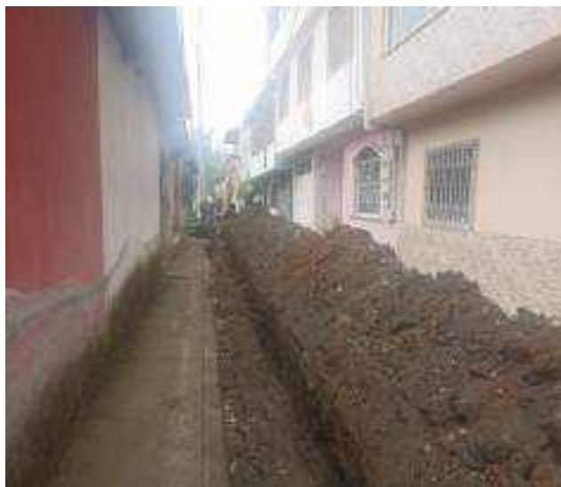
28 DICIEMBRE – 2022. RELLENO EXCAVACION POR CAMBIO DE RED DE ALCANTARILLADO SANITARIO, CALLE; PASAJE 3 ENTRE PRIMERA CONSTITUYENTE Y ABDON CALDERON.