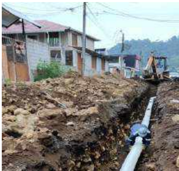
8 JUNIO – 2022. EXCAVACIÓN POR EXTENSION DE TUBERIA DE ALCANTARILLADO SANITARIO, CALLE MANUEL CARCHI ENTRE JAIME CABRERA Y RICARDO ESPINOZA