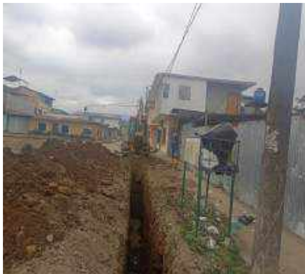
14 NOVIEMBRE – 2022. EXCAVACION POR CAMBIO DE RED DE ALCANTARILLADO SANITARIO, CALLE; CESAR CALVOPIÑA ENTRE CALLEJON PEATONAL Y ABDON CALDERON.