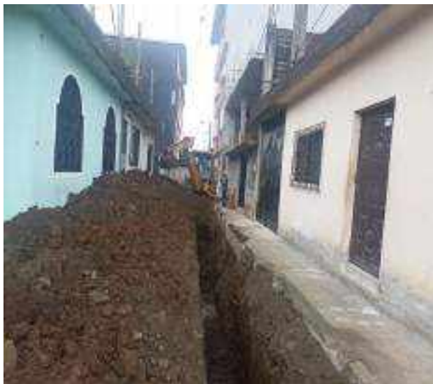
9 NOVIEMBRE – 2022. RELLENO POR CAMBIO DE RED DE ALCANTARILLADO SANITARIO, CALLE; PASAJE 2 ENTRE 24 DE MAYO Y 5 DE JUNIO.