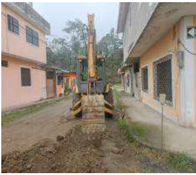
31 OCTUBRE – 2022. EXCAVACION POR CAMBIO DE RED DE ALCANTARILLADO SANITARIO, CALLE; ABDON CALDERON ENTRE CESAR CALVOPIÑA Y PASAJE 3.