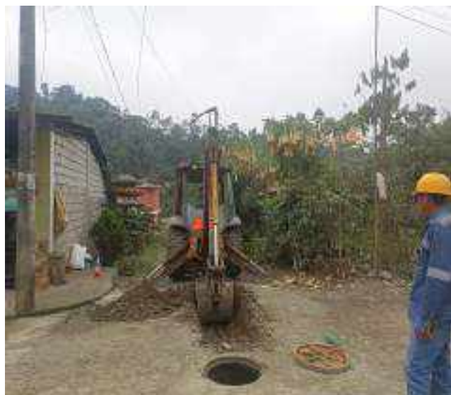
21 SEPTIEMBRE – 2022. EXCAVACION POR CAMBIO DE RED DE ALCANTARILLADO SANITARIO, CALLE TRANSVERSAL A ENTRE 4 DE DICIEMBRE Y PASAJE D