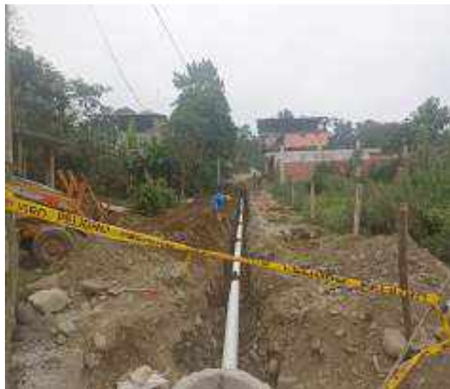
20 SEPTIEMBRE – 2022. EXCAVACION POR EXTENSION DE RED DE ALCANTARILLADO SANITARIO, CALLE MARTIN ORTEGA ENTRE 4 DE DICIEMBRE Y ATAHUALPA