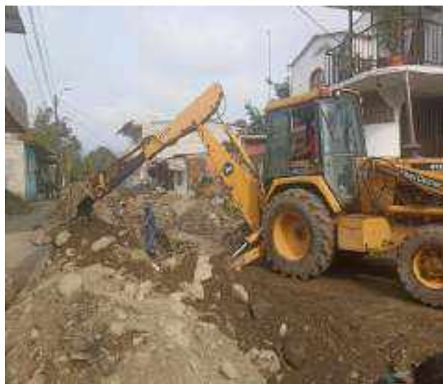
4 OCTUBRE – 2022. RELLENO POR CAMBIO DE RED DE ALCANTARILLADO SANITARIO, CALLE; ATAHUALPA ENTRE TRANSVERSAL A Y MIGUEL ANDRADE.