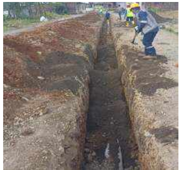
16 JUNIO - 2022. EXCAVACIÓN POR EXTENSION DE TUBERIA DE ALCANTARILLADO SANITARIO, CALLE MANUEL CAGUANA ENTRE CESAR CALVOPIÑA Y PASAJE A