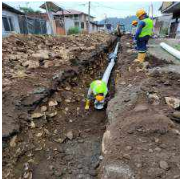
8 JUNIO – 2022. EXCAVACIÓN POR EXTENSION DE TUBERIA DE ALCANTARILLADO SANITARIO, CALLE MANUEL CARCHI ENTRE JAIME CABRERA Y RICARDO ESPINOZA