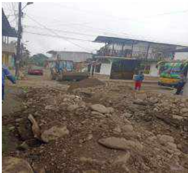
14 OCTUBRE – 2022. RELLENO POR CAMBIO DE RED DE ALCANTARILLADO SANITARIO, CALLE; CALLEJON A Y MIGUEL ANDRADE