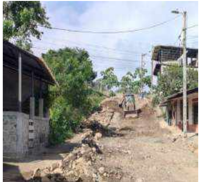
28 JUNIO – 2022. RELLENO DE ZANJA POR CAMBIO DE TUBERIA DE ALCANTARILLADO SANITARIO, CALLE DIGNO ESPINOZA ENTRE 9 DE OCTUBRE Y SIMON BOLIVAR