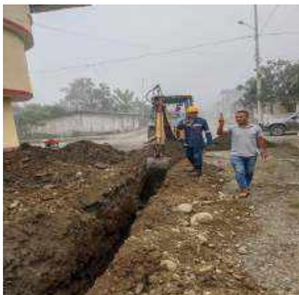
1 JUNIO – 2022. EXCAVACIÓN POR CAMBIO DE TUBERIA DE ALCANTARILLADO SANITARIO, CALLE MATEO MAQUISACA ENTRE 28 DE ENERO Y RUMIÑAHUI