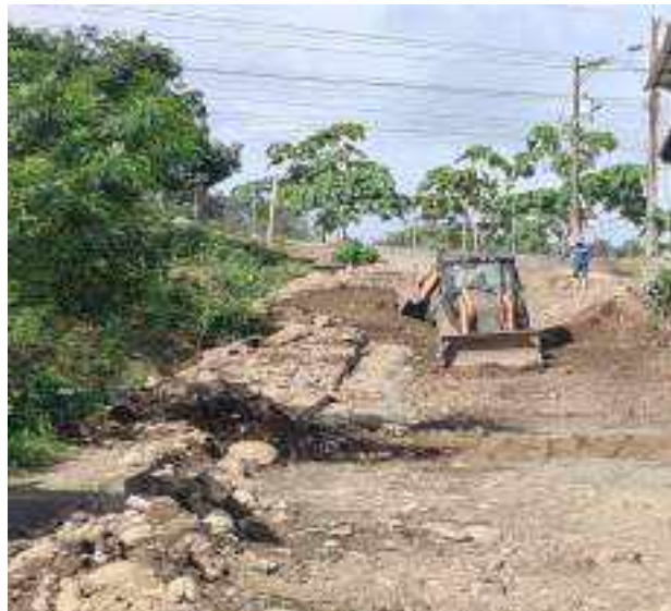
17 JUNIO – 2022. RETIRO DE MATERIAL POR CAMBIO Y EXTENSION DE RED DE ALCANTARILLADO SANITARIO, CALLES EDMUNDO VILLACRES, MANUEL CAGUANA Y CESAR CALVOPIÑA