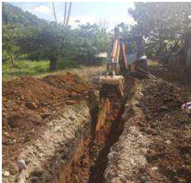
20 JULIO – 2022. EXCAVACIÓN POR EXTENSION DE RED DE ALCANTARILLADO SANITARIO, CALLE FRANCISCO CHAVEZ ENTRE SEGUNDO MERINO Y TRANSVERSAL 6