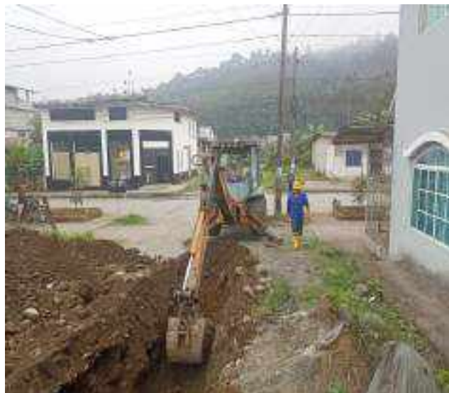
17 AGOSTO – 2022. EXCAVACION POR EXTENSION DE RED DE ALCANTARILLADO SANITARIO, CALLE 28 DE ENERO ENTRE 4 DE DICIEMBRE Y TALUD