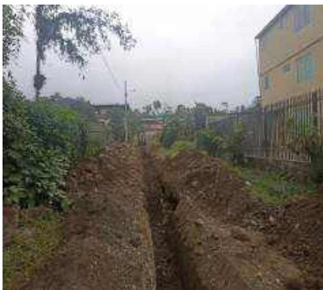
16 SEPTIEMBRE – 2022. RELLENO POR EXTENSION DE RED DE ALCANTARILLADO SANITARIO, CALLE MARTIN ORTEGA ENTRE ATAHUALPA Y CRISTOBAL COLON