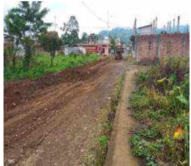
7 JUNIO – 2022. EXCAVACIÓN POR EXTENSION DE TUBERIA DE ALCANTARILLADO SANITARIO, CALLE EUGENIO ESPEJO ENTRE PERIMETRAL Y CESAR CALVOPIÑA