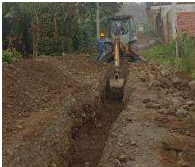
19 SEPTIEMBRE – 2022. LIMPIEZA DE CALLES POR EXTENSION DE RED DE ALCANTARILLADO SANITARIO, CALLE MARTIN ORTEGA ENTRE ATAHUALPA Y CRISTOBAL COLONEDMUNDO CUADRADO ENTRE ATAHUALPA Y CRISTOBAL COLON