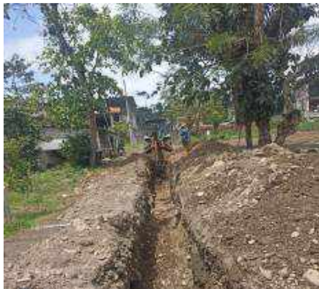
25 AGOSTO – 2022. EXCAVACION POR EXTENSION DE RED DE ALCANTARILLADO SANITARIO, CALLE EDMUNDO CUADRADO ENTRE 4 DE DICIEMBRE Y ATAHUALPA