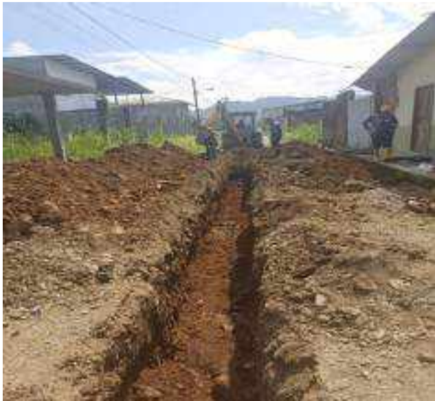
16 JUNIO - 2022. EXCAVACIÓN POR EXTENSION DE TUBERIA DE ALCANTARILLADO SANITARIO, CALLE MANUEL CAGUANA ENTRE CESAR CALVOPIÑA Y PASAJE A