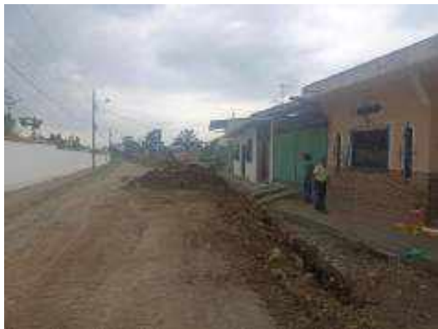
19 DICIEMBRE – 2022. RELLENO POR CAMBIO DE RED DE ALCANTARILLADO SANITARIO, CALLE; PASAJE 1 ENTRE PRIMERA CONSTITUYENTE Y ABDON CALDERON.