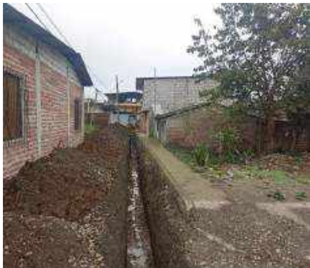
27 DICIEMBRE – 2022. EXCAVACION POR CAMBIO DE RED DE ALCANTARILLADO SANITARIO, CALLE; CESAR CALVOPINA ENTRE PRIMERA CONSTITUYENTE Y ABDON CALDERON.