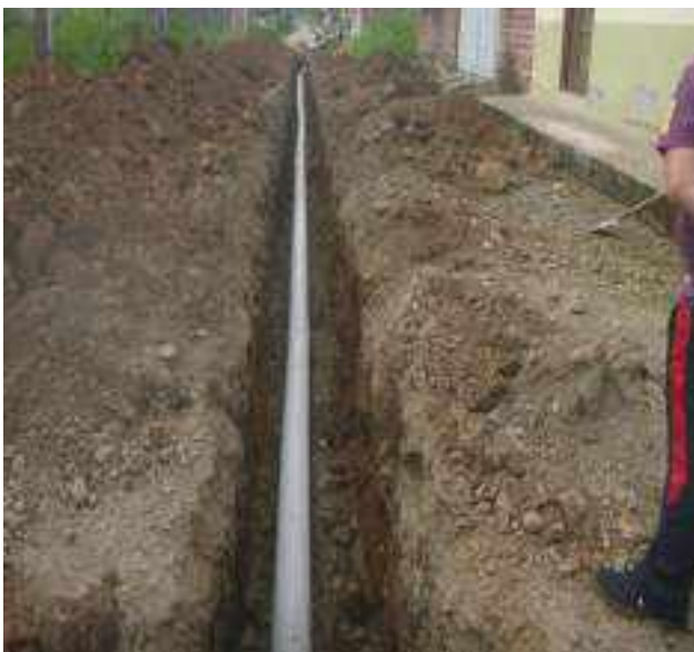
15 JUNIO – 2022. EXCAVACIÓN POR CAMBIO DE TUBERIA DE ALCANTARILLADO SANITARIO, CALLE 24 DE MAYO PASAJE Y CRISTOBAL COLON