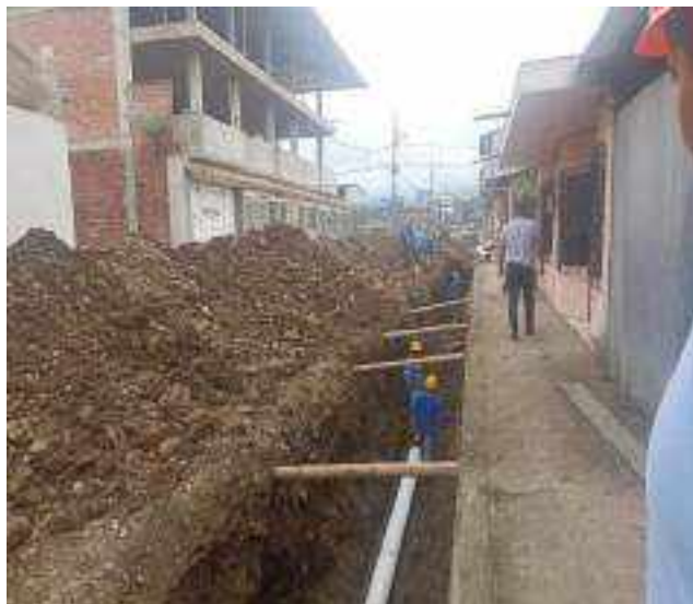
2 DICIEMBRE – 2022. EXCAVACION POR CAMBIO DE RED DE ALCANTARILLADO SANITARIO, CALLE; CELINDA MUÑOZ ENTRE CALLEJON PEATONAL Y 24 DE MAYO.