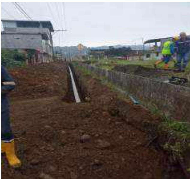
6 JUNIO – 2022. EXCAVACIÓN POR EXTENSION DE TUBERIA DE ALCANTARILLADO SANITARIO, CALLE ELOY ALFARO ENTRE MATEO MAQUISACA Y CELINDA MUÑOZ