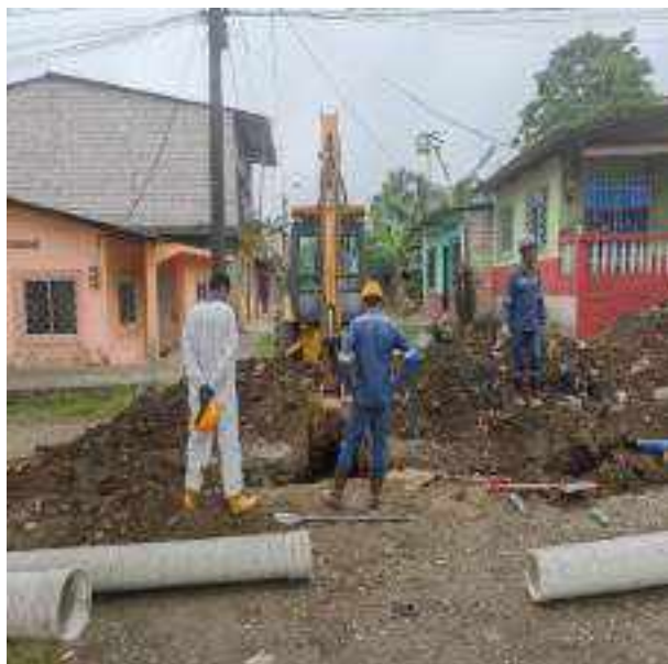
29 SEPTIEMBRE – 2022. EXCAVACION POR CAMBIO DE RED DE ALCANTARILLADO SANITARIO, CALLE MIGUEL ANDRADE ENTRE PASAJE D Y ATAHUALPA