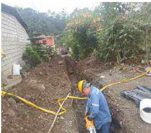
22 SEPTIEMBRE – 2022. EXCAVACION POR CAMBIO DE RED DE ALCANTARILLADO SANITARIO, CALLE TRANSVERSAL A ENTRE ATAHUALPA Y CALLEJON A