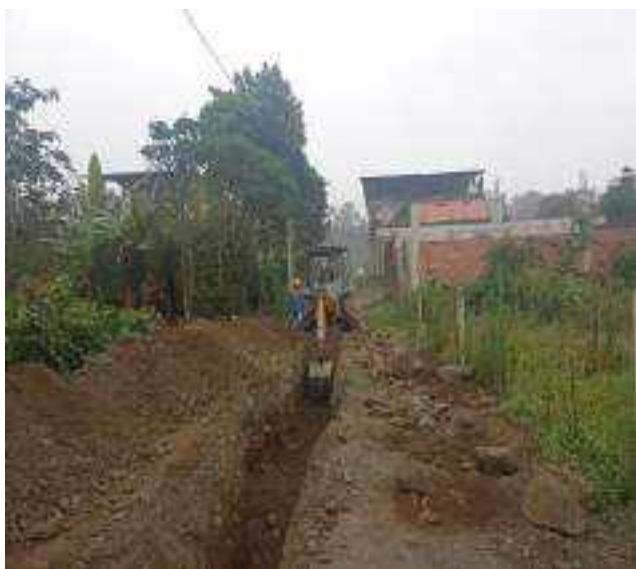
15 SEPTIEMBRE – 2022. EXCAVACION POR EXTENSION DE RED DE ALCANTARILLADO SANITARIO, CALLE MARTIN ORTEGA ENTRE ATAHUALPA Y CRISTOBAL COLON