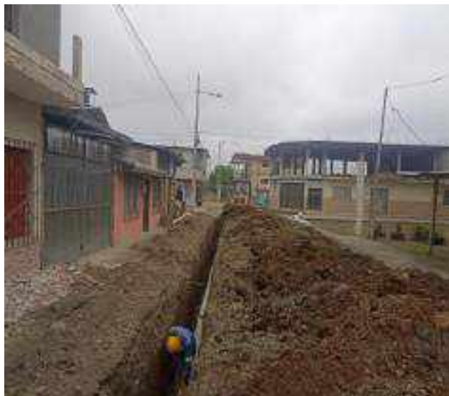
18 NOVIEMBRE – 2022. RELLENO POR CAMBIO DE RED DE ALCANTARILLADO SANITARIO, CALLE; CESAR CALVOPIÑA ENTRE 5 DE JUNIO Y CALLEJON PEATONAL.