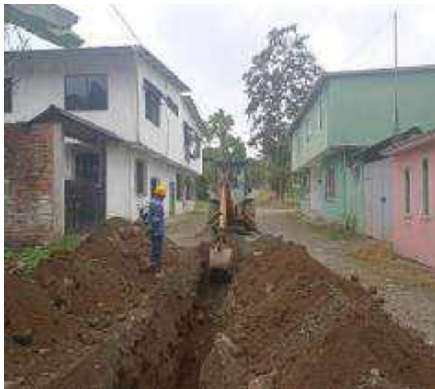
8 SEPTIEMBRE – 2022. EXCAVACION POR EXTENSION DE RED DE ALCANTARILLADO SANITARIO, CALLE CUADRADO ENTRE ATAHUALPA Y CRISTOBAL COLON