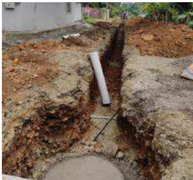
26 JULIO – 2022. EXCAVACIÓN POR EXTENSION DE RED DE ALCANTARILLADO SANITARIO, CALLE CELINDA MUÑOZ ENTRE SEGUNDO MERINO Y FLAVIO MARTINEZ