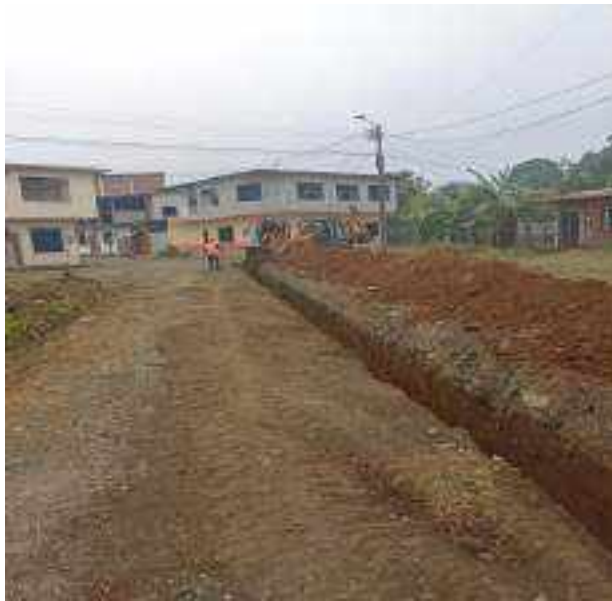
14 JULIO – 2022. EXCAVACIÓN POR EXTENSION DE RED DE ALCANTARILLADO SANITARIO, CALLE FRANCISCO CHAVEZ ENTRE BALTAZAR CURILLO Y MANUEL CAGUANA