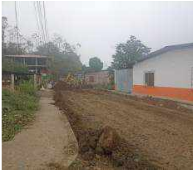
22 NOVIEMBRE – 2022. RELLENO POR CAMBIO DE RED DE ALCANTARILLADO SANITARIO, CALLE; 24 DE MAYO ENTRE CESAR CALVOPIÑA Y PASAJE 3.