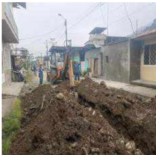
30 SEPTIEMBRE – 2022. EXCAVACION POR CAMBIO DE RED DE ALCANTARILLADO SANITARIO, CALLE ATAHUALPA ENTRE TRASNVERSAL A Y MIGUEL ANDRADE