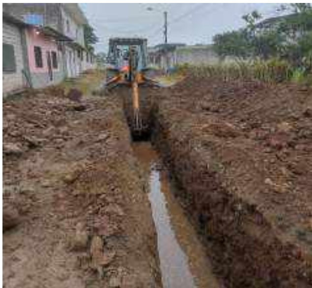
11 JULIO – 2022. EXCAVACIÓN POR CAMBIO DE TUBERIA DE ALCANTARILLADO SANITARIO, CALLE CELINDA MUÑOZ ENTRE MANUEL CARCHI Y RIOBAMBA