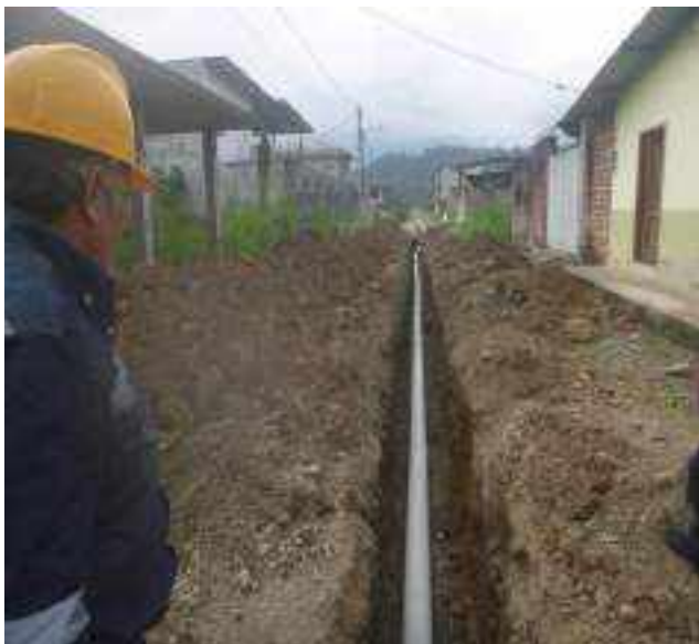
16 JUNIO - 2022. EXCAVACIÓN POR EXTENSION DE TUBERIA DE ALCANTARILLADO SANITARIO, CALLE MANUEL CAGUANA ENTRE CESAR CALVOPIÑA Y PASAJE A