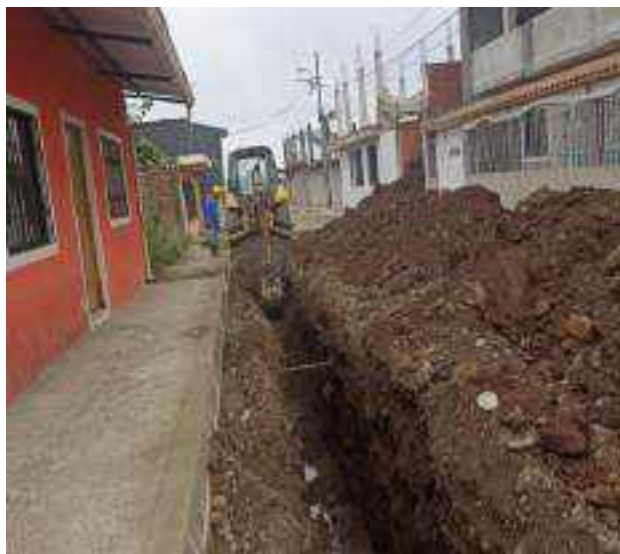
5 DICIEMBRE – 2022. EXCAVACION POR CAMBIO DE RED DE ALCANTARILLADO SANITARIO, CALLE; ABDON CALDERON ENTRE CELINDA MUÑOZ Y PASAJE 1.