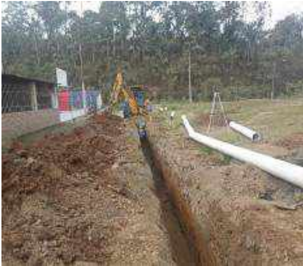
1 NOVIEMBRE – 2022. EXCAVACION POR CAMBIO DE RED DE ALCANTARILLADO SANITARIO, CALLE; ABDON CALDERON ENTRE CESAR CALVOPIÑA Y PERIMETRAL.