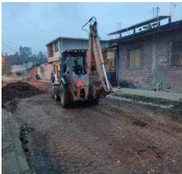
17 JUNIO – 2022. RETIRO DE MATERIAL POR CAMBIO Y EXTENSION DE RED DE ALCANTARILLADO SANITARIO, CALLES EDMUNDO VILLACRES, MANUEL CAGUANA Y CESAR CALVOPIÑA