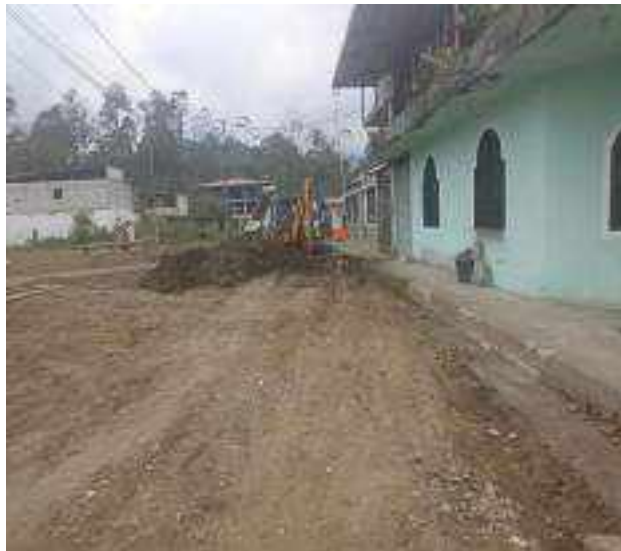
10 NOVIEMBRE – 2022. LIMPIEZA POR CAMBIO DE RED DE ALCANTARILLADO SANITARIO, CALLE; PASAJE 2 ENTRE 24 DE MAYO Y 5 DE JUNIO.