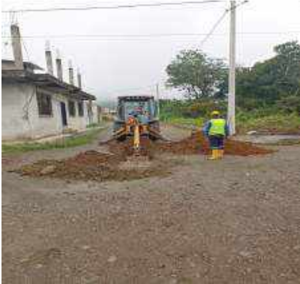
7 JUNIO – 2022. EXCAVACIÓN POR EXTENSION DE TUBERIA DE ALCANTARILLADO SANITARIO, CALLE EUGENIO ESPEJO ENTRE PERIMETRAL Y CESAR CALVOPIÑA