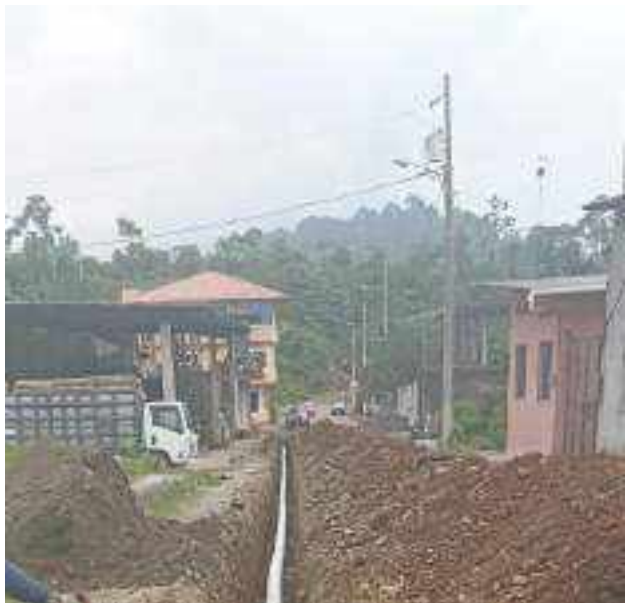
2 JUNIO – 2022. EXCAVACIÓN POR EXTENSION DE TUBERIA DE ALCANTARILLADO SANITARIO, CALLE RUMIÑAHUI ENTRE MATEO MAQUISACA Y RICARDO ESPINOZA