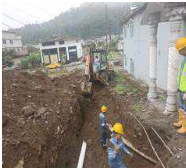
18 AGOSTO – 2022. RELLENO POR EXTENSION DE RED DE ALCANTARILLADO SANITARIO, CALLE 28 DE ENERO ENTRE 4 DE DICIEMBRE Y TALUD