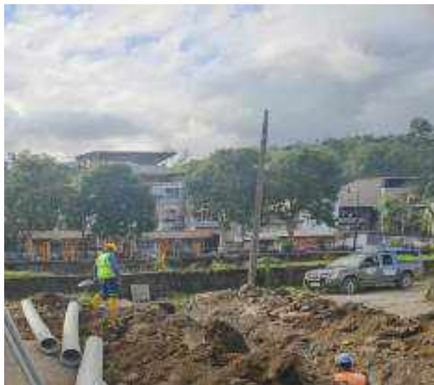
15 JUNIO – 2022. EXCAVACIÓN POR CAMBIO DE TUBERIA DE ALCANTARILLADO SANITARIO, CALLE 24 DE MAYO PASAJE Y CRISTOBAL COLON