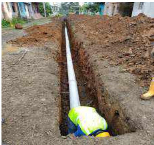
1 JULIO – 2022. RELLENO POR EXTENSION DE RED DE ALCANTARILLADO SANITARIO, CALLE CELINDA MUÑOZ ENTRE MANUEL CAGUANA Y MANUEL CHILUIZA