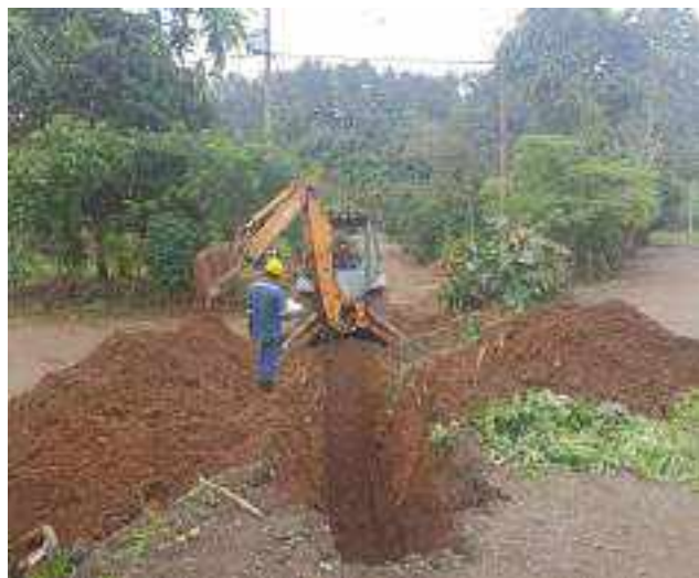
2 AGOSTO – 2022. EXCAVACION POR EXTENSION DE RED DE ALCANTARILLADO SANITARIO, CALLE FLAVIO MARTINEZ ENTRE CELINDA MUÑOZ Y MATEO MAQUISACA