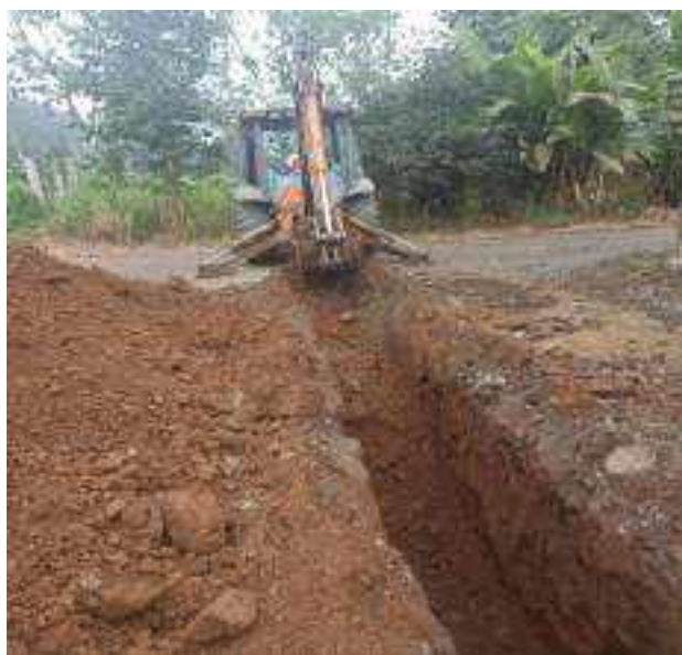
21 JULIO – 2022. EXCAVACIÓN POR EXTENSION DE RED DE ALCANTARILLADO SANITARIO, CALLE FRANCISCO CHAVEZ ENTRE SEGUNDO MERINO Y TRANSVERSAL 6