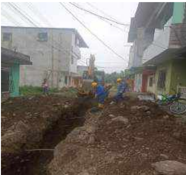
19 OCTUBRE – 2022. EXCAVACION POR CAMBIO DE RED DE ALCANTARILLADO SANITARIO, CALLE; PASAJE D HASTA MIGUEL ANDRADE.