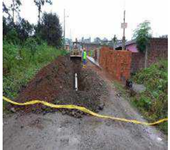
7 JUNIO – 2022. EXCAVACIÓN POR EXTENSION DE TUBERIA DE ALCANTARILLADO SANITARIO, CALLE EUGENIO ESPEJO ENTRE PERIMETRAL Y CESAR CALVOPIÑA