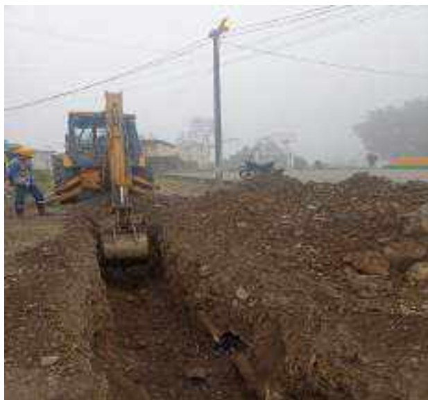
17 OCTUBRE – 2022. EXCAVACION POR CAMBIO DE RED DE ALCANTARILLADO SANITARIO, CALLE; CALLEJON A HASTA CRISTOBAL COLON.