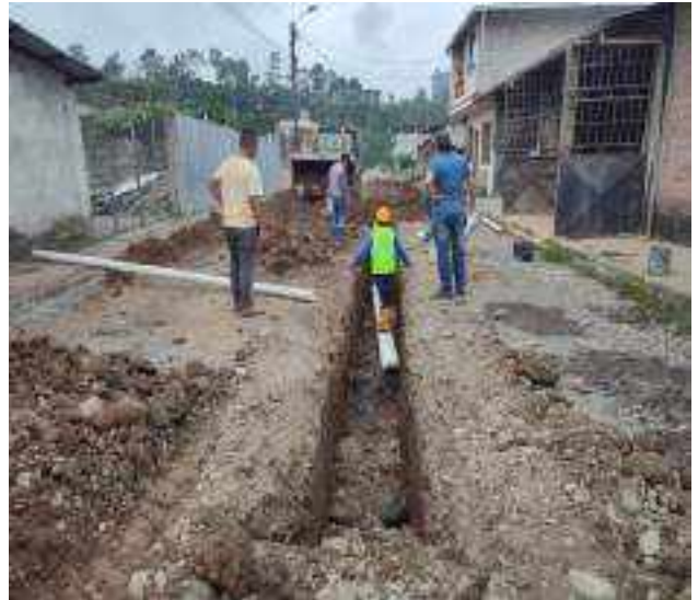
3 JUNIO – 2022. EXCAVACIÓN POR CAMBIO DE TUBERIA DE ALCANTARILLADO SANITARIO, CALLE ANTONIO JOSE DE SUCRE ENTRE JAIME CABRERA Y 10 DE AGOSTO