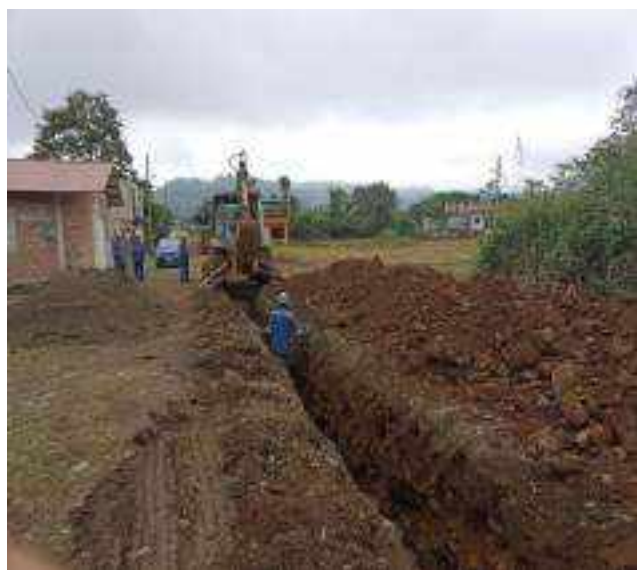
9 AGOSTO – 2022. RELLENO POR EXTENSION DE RED DE ALCANTARILLADO SANITARIO, CALLE SEGUNDO MERINO ENTRE PERIMETRAL Y FRANCISCO CHAVEZ