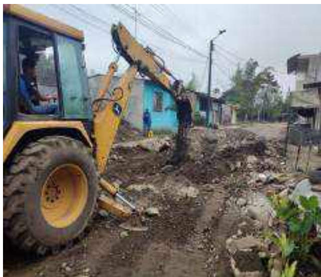
5 OCTUBRE – 2022. RELLENO POR CAMBIO DE RED DE ALCANTARILLADO SANITARIO, CALLE; MIGUEL ANDRADE ENTRE ATAHUALPA Y CALLEJON A.