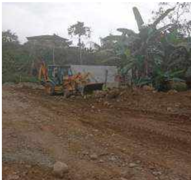
22 AGOSTO – 2022. LIMPIEZA DE CALLES EN EL BARRIO 9 DE DICIEMBRE, SE CULMINA