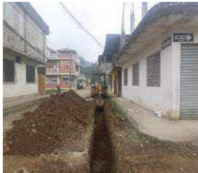
6 DICIEMBRE – 2022. RELLENO POR CAMBIO DE RED DE ALCANTARILLADO SANITARIO, CALLE; ABDON CALDERON ENTRE CELINDA MUÑOZ Y PASAJE 1.