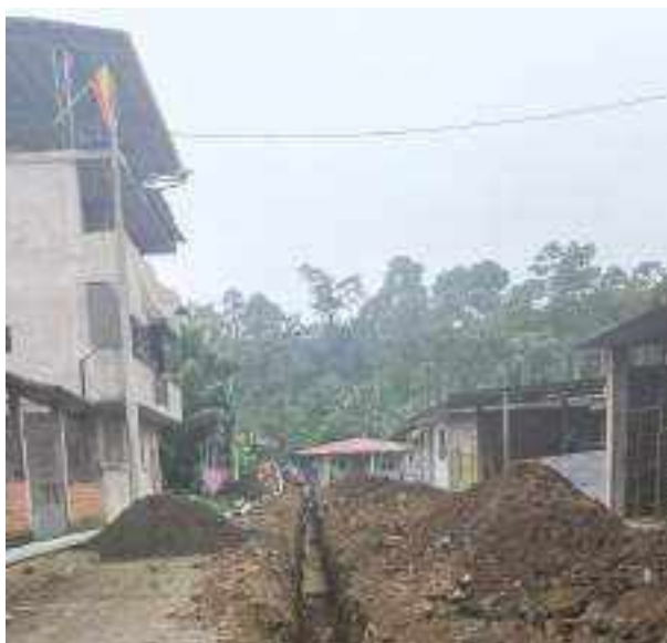
1 JUNIO – 2022. EXCAVACIÓN POR CAMBIO DE TUBERIA DE ALCANTARILLADO SANITARIO, CALLE MATEO MAQUISACA ENTRE 28 DE ENERO Y RUMIÑAHUI