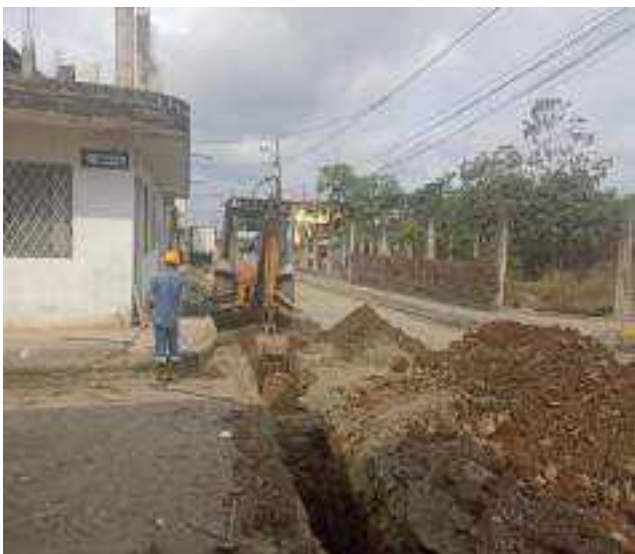
30 NOVIEMBRE – 2022. RELLENO POR CAMBIO DE RED DE ALCANTARILLADO SANITARIO, CALLE; CELINDA MUÑOZ ENTRE PRIMERA CONSTITUYENTE Y ABDON CALDERON.