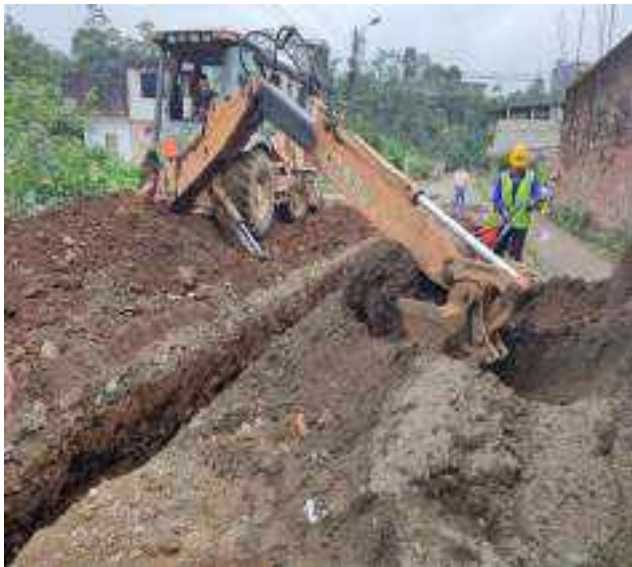
3 JUNIO – 2022. EXCAVACIÓN POR CAMBIO DE TUBERIA DE ALCANTARILLADO SANITARIO, CALLE ANTONIO JOSE DE SUCRE ENTRE JAIME CABRERA Y 10 DE AGOSTO