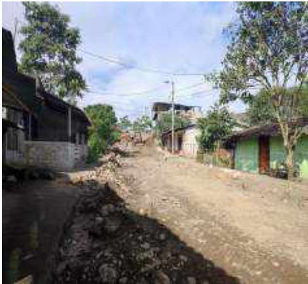
28 JUNIO – 2022. RELLENO DE ZANJA POR CAMBIO DE TUBERIA DE ALCANTARILLADO SANITARIO, CALLE DIGNO ESPINOZA ENTRE 9 DE OCTUBRE Y SIMON BOLIVAR