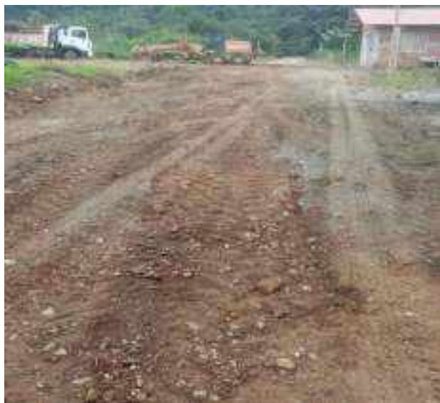
11 AGOSTO – 2022. LIMPIEZA DE CALLES EN EL BARRIO 9 DE DICIEMBRE Y DIVINO NIÑO