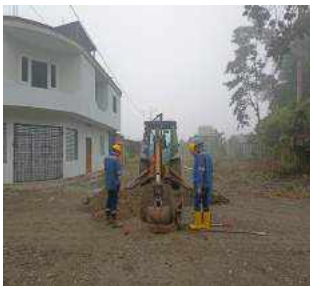
28 JULIO – 2022. EXCAVACIÓN POR EXTENSION DE RED DE ALCANTARILLADO SANITARIO, CALLE BALTAZAR CURILLO ENTRE CESAR CALVOPIÑA Y FRANCISCO CHAVEZ.