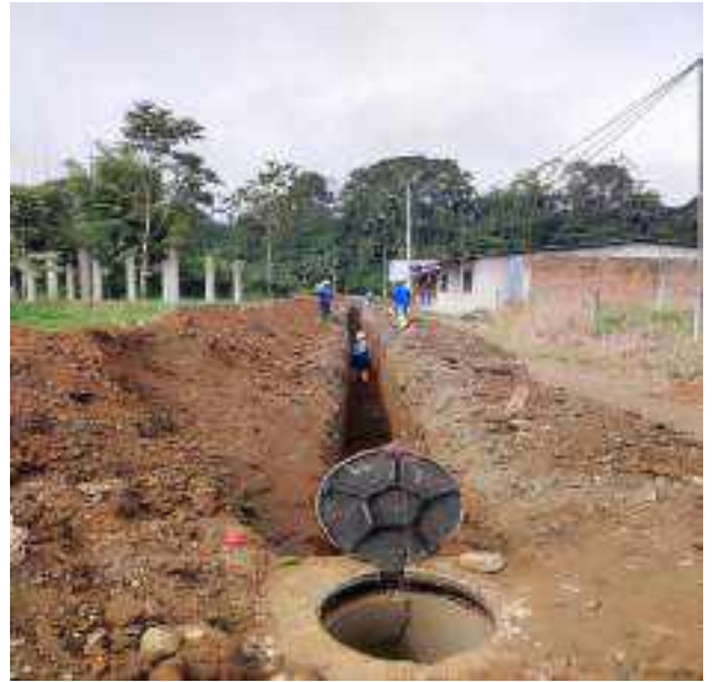
29 JULIO - 2022. RELLENO POR EXTENSION DE RED DE ALCANTARILLADO SANITARIO, CALLE BALTAZAR CURILLO ENTRE CESAR CALVOPIÑA Y FRANCISCO CHAVEZ