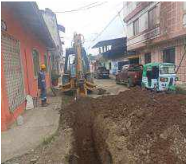
24 NOVIEMBRE – 2022. LIMPIEZA POR CAMBIO DE RED DE ALCANTARILLADO SANITARIO, CALLE; CESAR CALVOPIÑA ENTRE CALLEJON PEATONAL Y 24 DE MAYO.