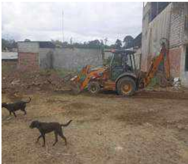
27 SEPTIEMBRE – 2022. RELLENO POR CAMBIO DE RED DE ALCANTARILLADO SANITARIO, CALLE CALLEJON A ENTRE TRANSVERSAL A Y MIGUEL ANDRADE