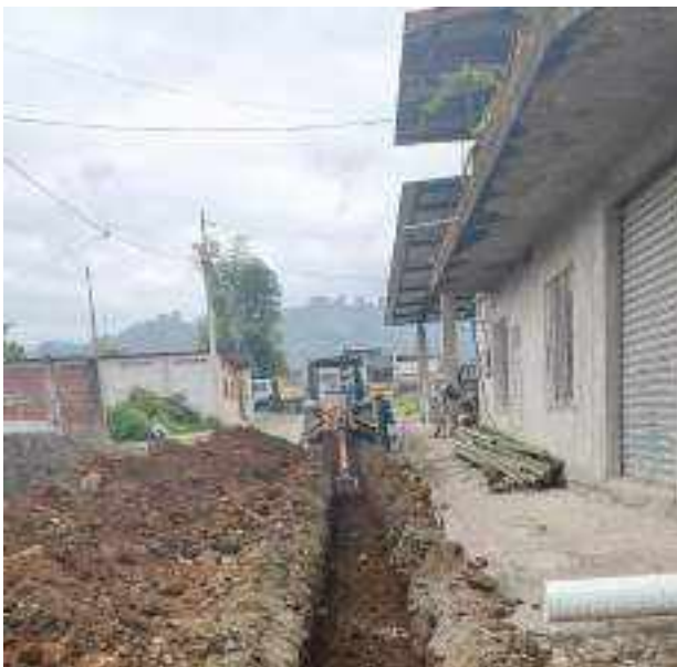
2 JUNIO – 2022. EXCAVACIÓN POR EXTENSION DE TUBERIA DE ALCANTARILLADO SANITARIO, CALLE RUMIÑAHUI ENTRE MATEO MAQUISACA Y RICARDO ESPINOZA