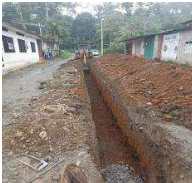
13 JUNIO - 2022. EXCAVACIÓN POR EXTENSION DE TUBERIA DE ALCANTARILLADO SANITARIO, CALLE MANUEL CARCHI ENTRE CESAR CALVOPIÑA Y PERIMETRAL