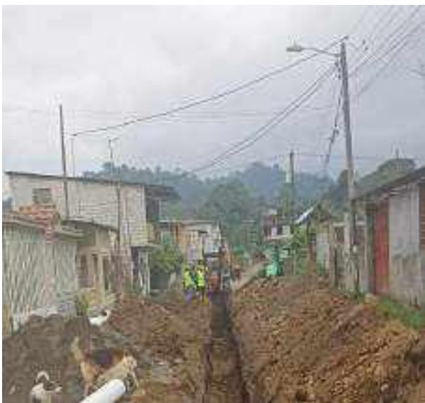
8 JUNIO – 2022. EXCAVACIÓN POR EXTENSION DE TUBERIA DE ALCANTARILLADO SANITARIO, CALLE MANUEL CARCHI ENTRE JAIME CABRERA Y RICARDO ESPINOZA