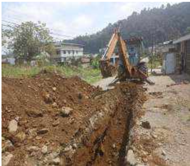
16 AGOSTO – 2022. EXCAVACION POR EXTENSION DE RED DE ALCANTARILLADO SANITARIO, CALLE 28 DE ENERO ENTRE 4 DE DICIEMBRE Y TALUD