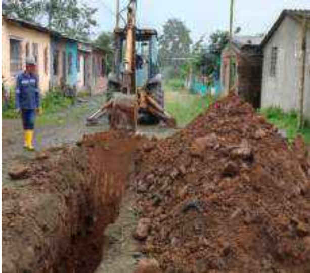
30 JUNIO – 2022. EXCAVACIÓN POR EXTENSION DE TUBERIA DE ALCANTARILLADO SANITARIO, CALLE CELINDA MUÑOZ ENTRE MANUEL CAGUANA Y MANUEL CHILUIZA