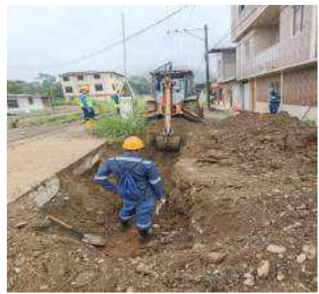
6 JUNIO – 2022. EXCAVACIÓN POR EXTENSION DE TUBERIA DE ALCANTARILLADO SANITARIO, CALLE ELOY ALFARO ENTRE MATEO MAQUISACA Y CELINDA MUÑOZ