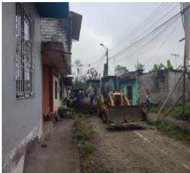
18 OCTUBRE – 2022. RELLENO POR CAMBIO DE RED DE ALCANTARILLADO SANITARIO, CALLE; CALLEJON A HASTA LAS DESCARGA EN LA CALLE CRISTOBAL COLON.