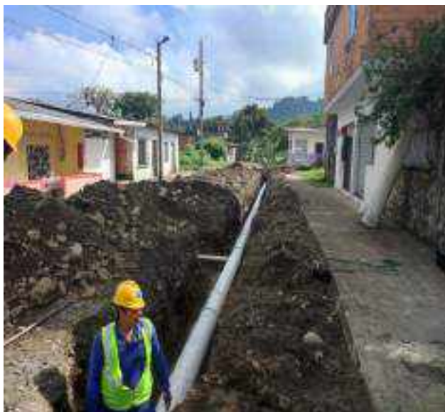
27 JUNIO – 2022. EXCAVACIÓN POR CAMBIO DE TUBERIA DE ALCANTARILLADO SANITARIO, CALLE DIGNO ESPINOZA ENTRE 9 DE OCTUBRE Y SIMON BOLIVAR