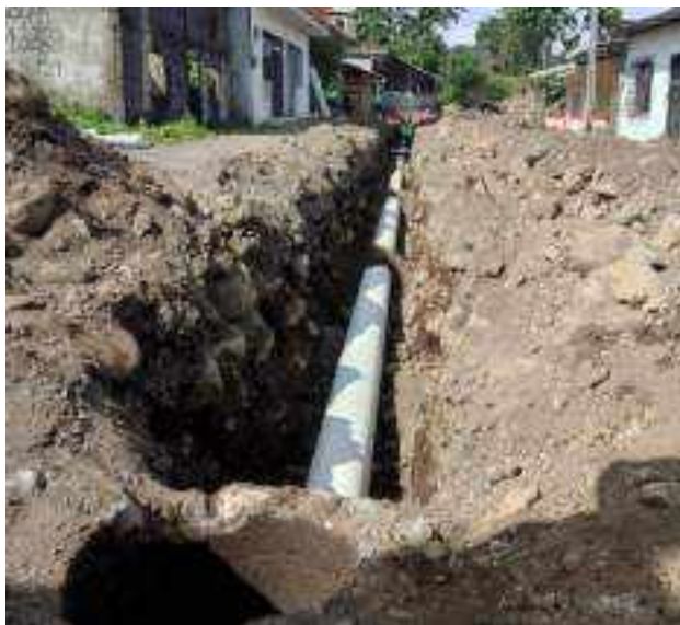
27 JUNIO – 2022. EXCAVACIÓN POR CAMBIO DE TUBERIA DE ALCANTARILLADO SANITARIO, CALLE DIGNO ESPINOZA ENTRE 9 DE OCTUBRE Y SIMON BOLIVAR