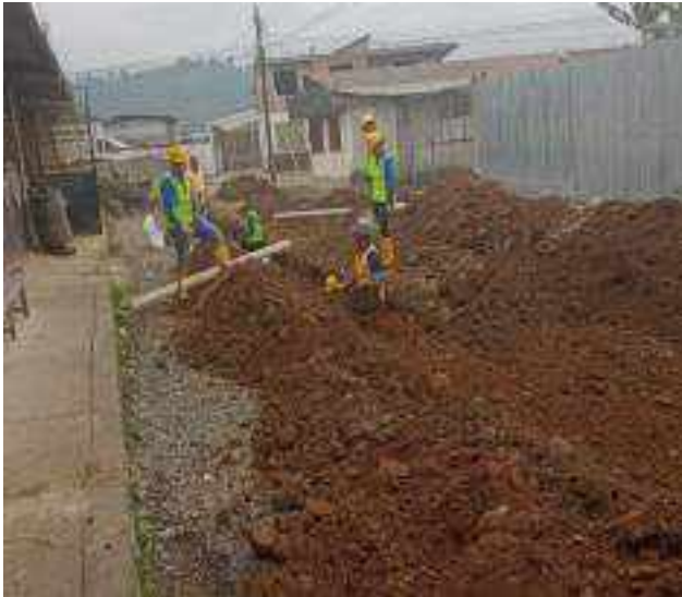
3 JUNIO – 2022. EXCAVACIÓN POR CAMBIO DE TUBERIA DE ALCANTARILLADO SANITARIO, CALLE ANTONIO JOSE DE SUCRE ENTRE JAIME CABRERA Y 10 DE AGOSTO