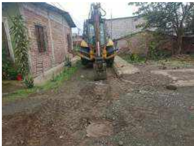
21 DICIEMBRE – 2022. RELLENO POR CAMBIO DE RED DE ALCANTARILLADO SANITARIO, CALLE; CALLEJON DEL OLEODUCTO Y MANUEL CAHUANA.