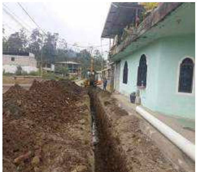
8 NOVIEMBRE – 2022. EXCAVACION POR CAMBIO DE RED DE ALCANTARILLADO SANITARIO, CALLE; PASAJE 2 ENTRE 24 DE MAYO Y 5 DE JUNIO.