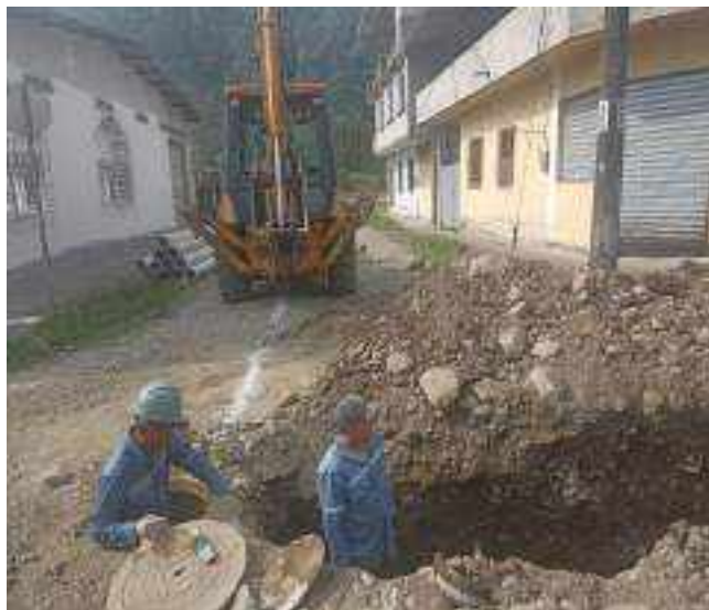
3 OCTUBRE – 2022. EXCAVACION POR CAMBIO DE RED DE ALCANTARILLADO SANITARIO, CALLE; MIGUEL ANDRADE ENTRE ATAHUALPA Y CALLEJON A.