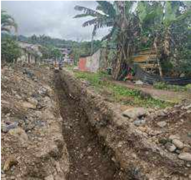
14 JUNIO – 2022. EXCAVACIÓN POR CAMBIO DE TUBERIA DE ALCANTARILLADO SANITARIO, CALLE 24 DE MAYO ENTRE EDMUNDO VILLACRES Y PASAJE