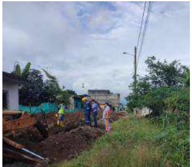
30 JUNIO – 2022. EXCAVACIÓN POR EXTENSION DE TUBERIA DE ALCANTARILLADO SANITARIO, CALLE CELINDA MUÑOZ ENTRE MANUEL CAGUANA Y MANUEL CHILUIZA