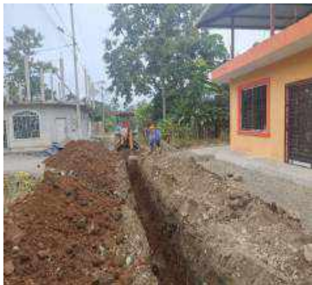
25 JULIO – 2022. EXCAVACIÓN POR EXTENSION DE RED DE ALCANTARILLADO SANITARIO, CALLE CELINDA MUÑOZ ENTRE MANUEL CHILUIZA Y SEGUNDO MERINO