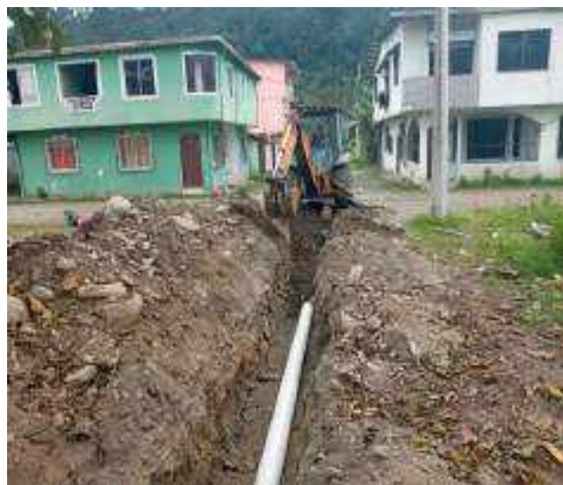
30 AGOSTO – 2022. EXCAVACION POR EXTENSION DE RED DE ALCANTARILLADO SANITARIO, CALLE EDMUNDO CUADRADO ENTRE CRISTOBAL COLON Y ATAHUALPA