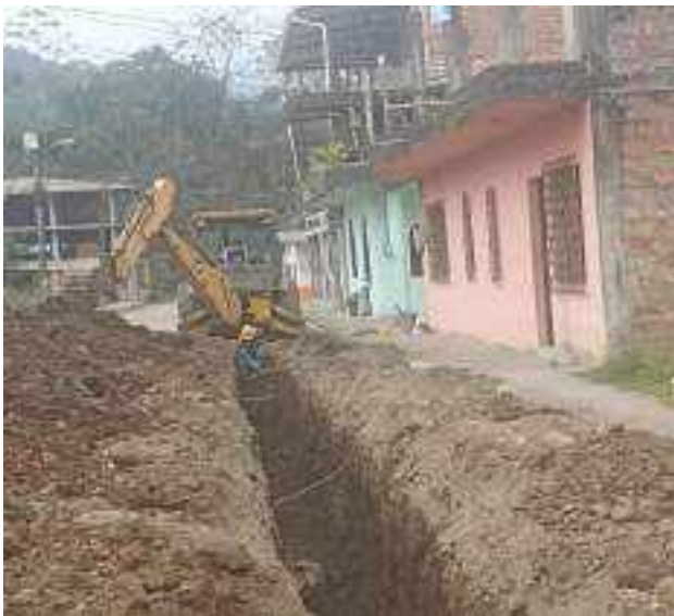
7 NOVIEMBRE – 2022. EXCAVACION POR CAMBIO DE RED DE ALCANTARILLADO SANITARIO, CALLE; 24 DE MAYO ENTRE FRANCISCO CHAVEZ Y PASAJE 2.