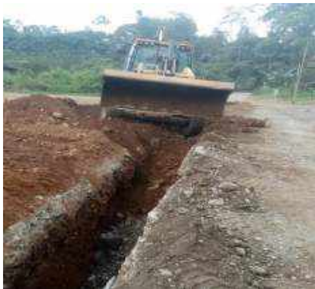
5 AGOSTO – 2022. RELLENO POR EXTENSION DE RED DE ALCANTARILLADO SANITARIO, CALLE SEGUNDO MERINO ENTRE MATEO MAQUISACA Y CELINDA MUÑOZ