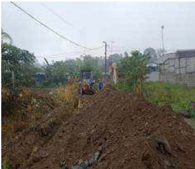
23 SEPTIEMBRE – 2022. EXCAVACION POR CAMBIO DE RED DE ALCANTARILLADO SANITARIO, CALLE TRANSVERSAL A ENTRE ATAHUALPA Y CALLEJON A