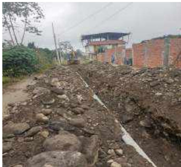
13 OCTUBRE – 2022. RELLENO POR CAMBIO DE RED DE ALCANTARILLADO SANITARIO, CALLE; ATAHUALPA ENTRE MIGUEL ANDRADE Y PASAJE C.