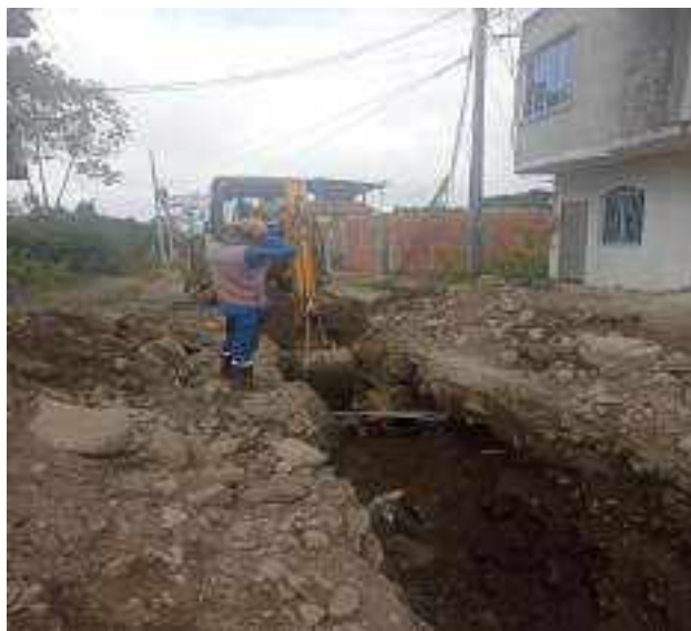
11 OCTUBRE – 2022. EXCAVACION POR CAMBIO DE RED DE ALCANTARILLADO SANITARIO, CALLE; ATAHUALPA ENTRE MIGUEL ANDRADE Y PASAJE C.