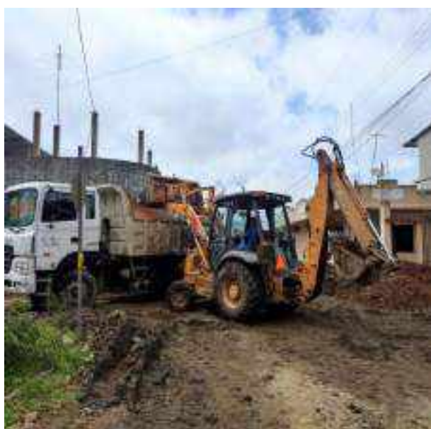
6 JULIO – 2022. RELLENO POR EXTENSION DE RED DE ALCANTARILLADO SANITARIO, CALLE MANUEL CAGUANA ENTRE MATEO MAQUISACA Y CELINDA MUÑOZ. CALLE CELINDA MUÑOZ ENTRE MANUEL CAGUANA Y BALTAZAR CURILLO.