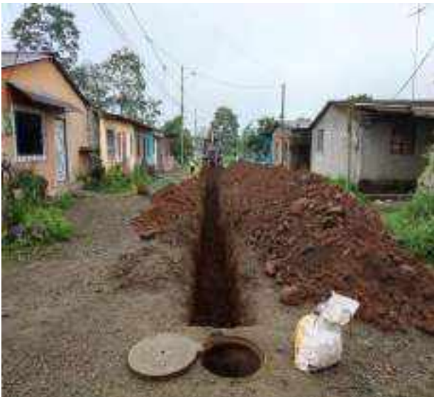
30 JUNIO – 2022. EXCAVACIÓN POR EXTENSION DE TUBERIA DE ALCANTARILLADO SANITARIO, CALLE CELINDA MUÑOZ ENTRE MANUEL CAGUANA Y MANUEL CHILUIZA