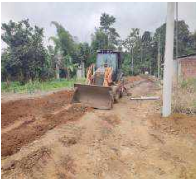
29 JULIO - 2022. RELLENO POR EXTENSION DE RED DE ALCANTARILLADO SANITARIO, CALLE BALTAZAR CURILLO ENTRE CESAR CALVOPIÑA Y FRANCISCO CHAVEZ