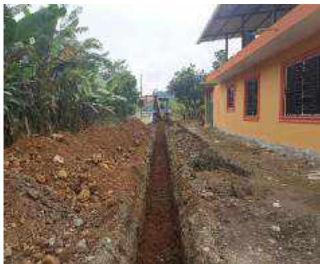
3 AGOSTO – 2022. EXCAVACION POR EXTENSION DE RED DE ALCANTARILLADO SANITARIO, CALLE SEGUNDO MERINO ENTRE MATEO MAQUISACA Y CELINDA MUÑOZ