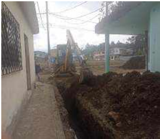
23 NOVIEMBRE – 2022. LIMPIEZA POR CAMBIO DE RED DE ALCANTARILLADO SANITARIO, CALLE; CESAR CALVOPIÑA ENTRE CALLEJON PEATONAL Y ABDON CALDERON.