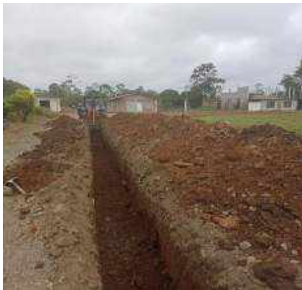
19 JULIO – 2022. EXCAVACIÓN POR EXTENSION DE RED DE ALCANTARILLADO SANITARIO, CALLE FRANCISCO CHAVEZ ENTRE MANUEL CHILUIZA Y SEGUNDO MERINO