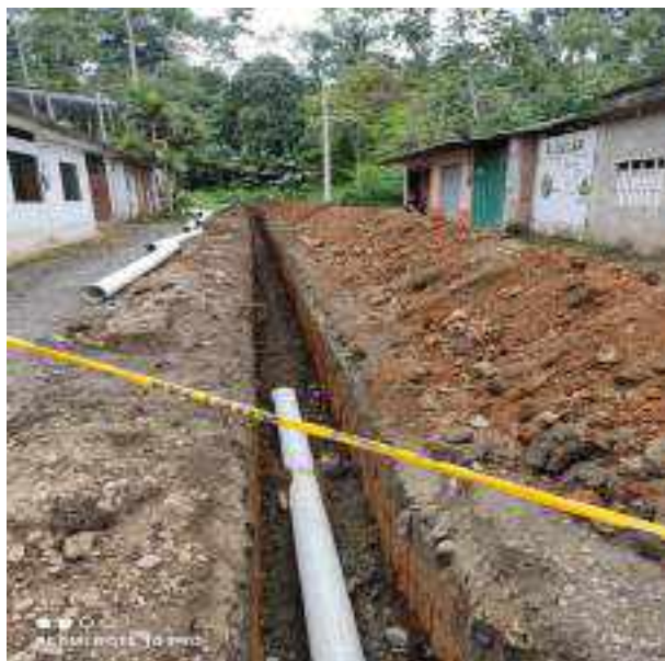
13 JUNIO - 2022. EXCAVACIÓN POR EXTENSION DE TUBERIA DE ALCANTARILLADO SANITARIO, CALLE MANUEL CARCHI ENTRE CESAR CALVOPIÑA Y PERIMETRAL