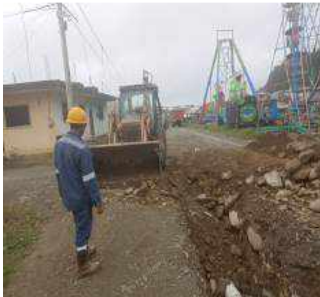
2 SEPTIEMBRE – 2022. RELLENO POR EXTENSION DE RED DE ALCANTARILLADO SANITARIO, CALLE CRISTOBAL COLON ENTRE MARTIN ORTEGA Y EDMUNDO CUADRADO