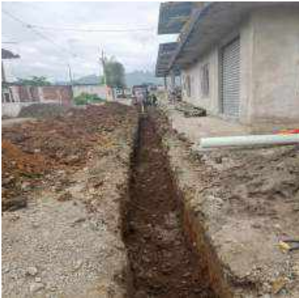
2 JUNIO – 2022. EXCAVACIÓN POR EXTENSION DE TUBERIA DE ALCANTARILLADO SANITARIO, CALLE RUMIÑAHUI ENTRE MATEO MAQUISACA Y RICARDO ESPINOZA