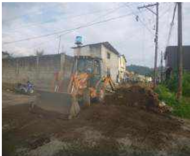
10 JUNIO – 2022. RELLENO DE ZANJA POR EXTENSION Y CAMBIO DE TUBERIA DE ALCANTARILLADO SANITARIO, CALLE MANUEL CARCHI ENTRE JRICARDO ESPINOZA Y 10 DE AGOSTO