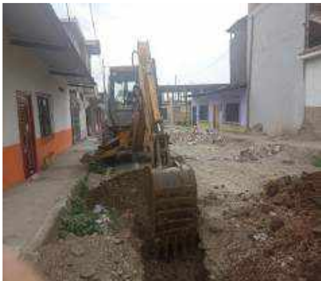
17 NOVIEMBRE – 2022. EXCAVACION POR CAMBIO DE RED DE ALCANTARILLADO SANITARIO, CALLE; CESAR CALVOPIÑA ENTRE 5 DE JUNIO Y 24 DE MAYO.