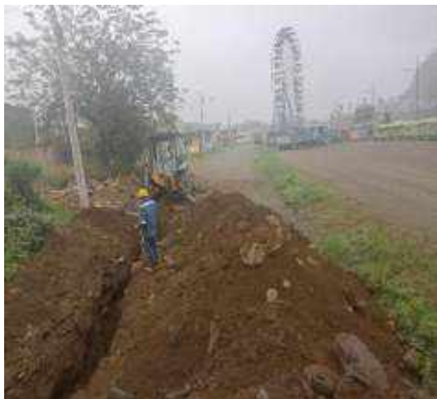
1 SEPTIEMBRE – 2022. RELLENO POR EXTENSION DE RED DE ALCANTARILLADO SANITARIO, CALLE EDMUNDO CUADRADO ENTRE 4 DE DICIEMBRE Y ATAHUALPA