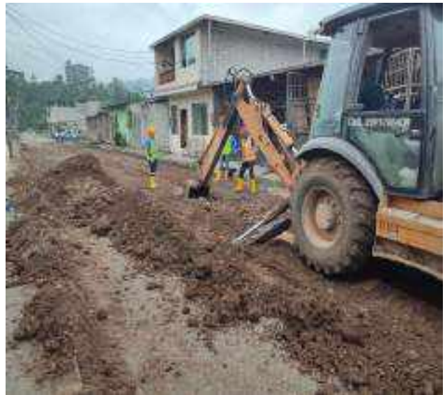
3 JUNIO – 2022. EXCAVACIÓN POR CAMBIO DE TUBERIA DE ALCANTARILLADO SANITARIO, CALLE ANTONIO JOSE DE SUCRE ENTRE JAIME CABRERA Y 10 DE AGOSTO