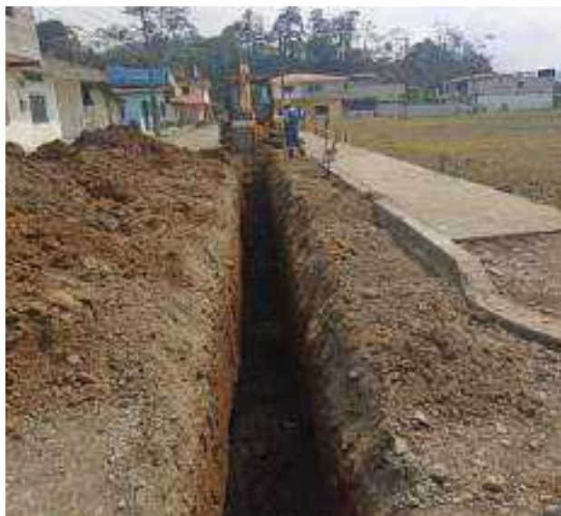
26 OCTUBRE – 2022. EXCAVACION POR CAMBIO DE RED DE ALCANTARILLADO SANITARIO, CALLE; ABDON CALDERON ENTRE FRANCISCO CHAVEZ Y PASAJE 2.