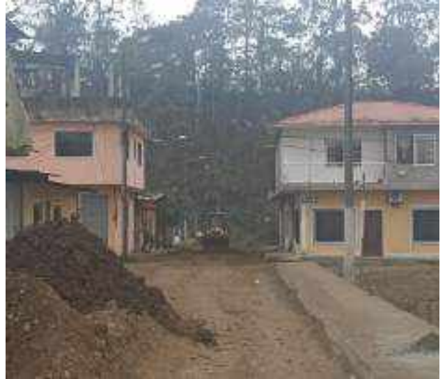
2 NOVIEMBRE – 2022. RELLENO POR CAMBIO DE RED DE ALCANTARILLADO SANITARIO, CALLE; ABDON CALDERON ENTRE CESAR CALVOPIÑA Y PERIMETRAL.