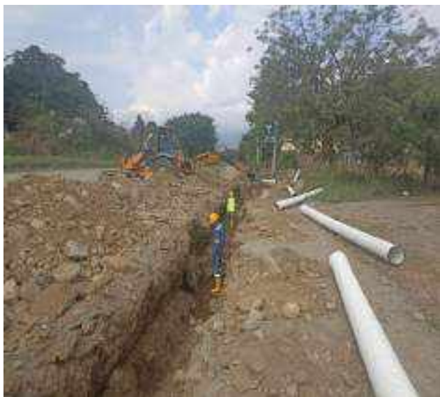
6 SEPTIEMBRE – 2022. EXCAVACION POR EXTENSION DE RED DE ALCANTARILLADO SANITARIO, CALLE CRISTOBAL COLON ENTRE EDMUNDO CUADRADO Y MARIO NARANJO