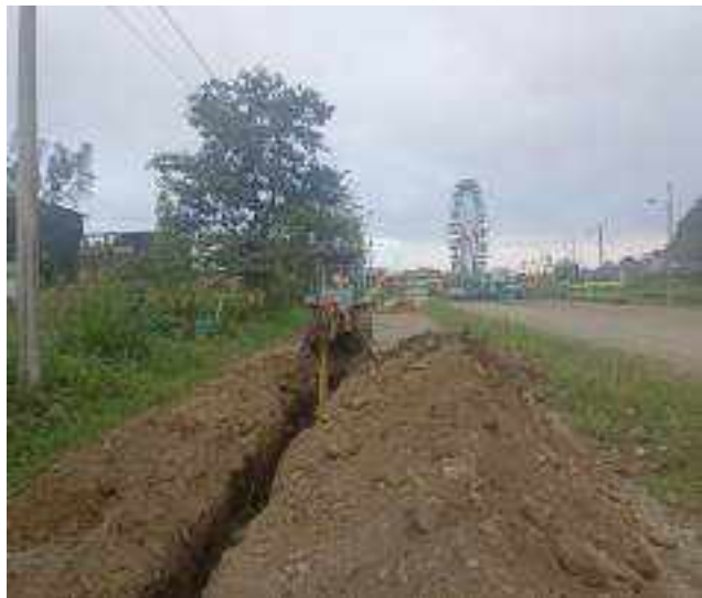
30 AGOSTO – 2022. EXCAVACION POR EXTENSION DE RED DE ALCANTARILLADO SANITARIO, CALLE EDMUNDO CUADRADO ENTRE CRISTOBAL COLON Y ATAHUALPA