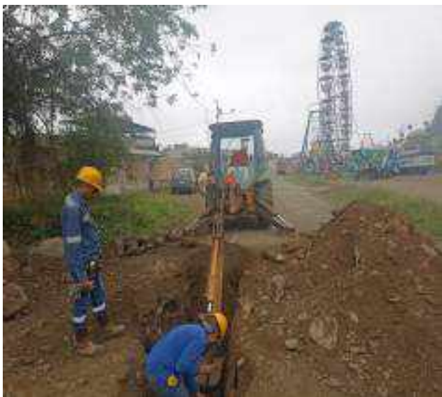
5 SEPTIEMBRE – 2022. EXCAVACION POR EXTENSION DE RED DE ALCANTARILLADO SANITARIO, CALLE CRISTOBAL COLON ENTRE EDMUNDO CUADRADO Y MARIO NARANJO