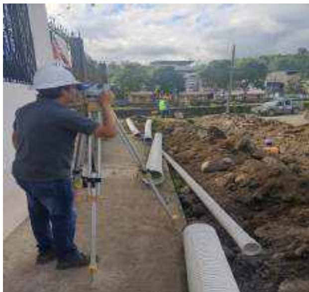
15 JUNIO – 2022. EXCAVACIÓN POR CAMBIO DE TUBERIA DE ALCANTARILLADO SANITARIO, CALLE 24 DE MAYO PASAJE Y CRISTOBAL COLON