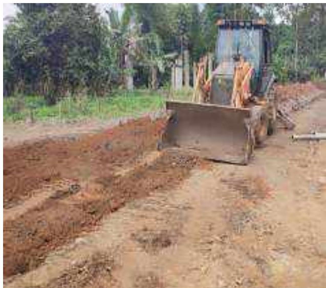
24 AGOSTO – 2022. LIMPIEZA DE CALLES EN LA CALLE 28 DE ENERO ENTRE 4 DE DICIEMBRE Y TALUD