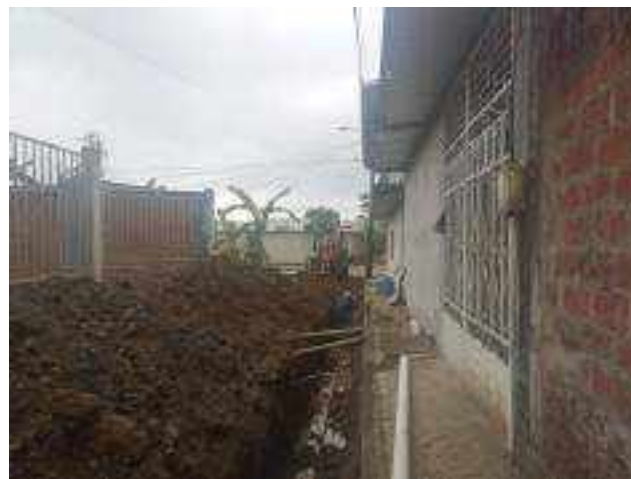
22 DICIEMBRE – 2022. RELLENO POR CAMBIO DE RED DE ALCANTARILLADO SANITARIO, CALLE; CALLEJON DEL OLEODUCTO Y MANUEL CAHUANA.