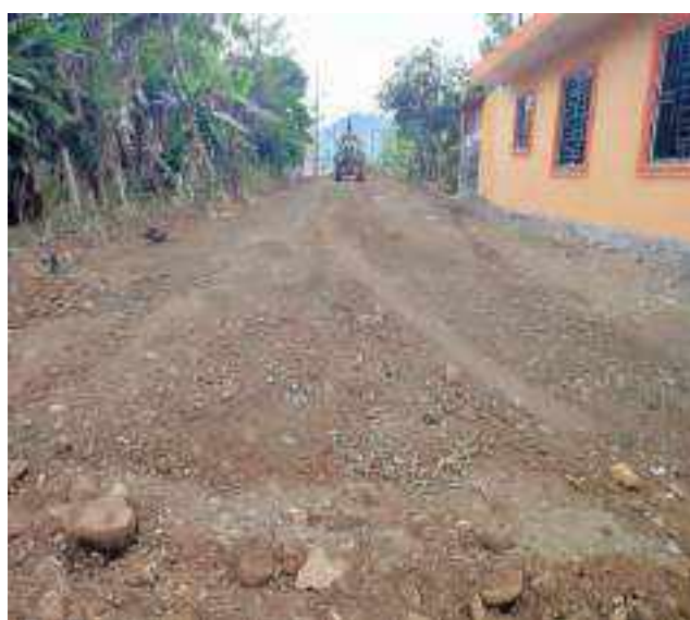
10 AGOSTO – 2022. LIMPIEZA DE CALLES EN EL BARRIO 9 DE DICIEMBRE