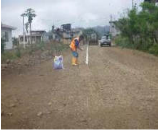
Noviembre 8 - 2018. Excavación para extensión de red matriz de Agua Potable en el sector de La Pampa.