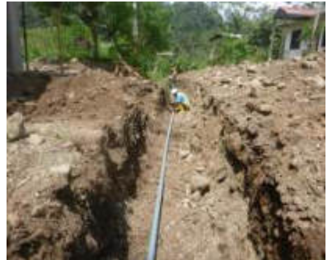
Enero - 2018. Excavación para extensión de red de agua potable calle: Martin Ortega entre 4 de Diciembre y Eloy Chicaiza.