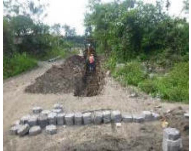
Enero - 2018. Excavación para extensión de red de agua potable calle: Martin Ortega entre 4 de Diciembre y Eloy Chicaiza.