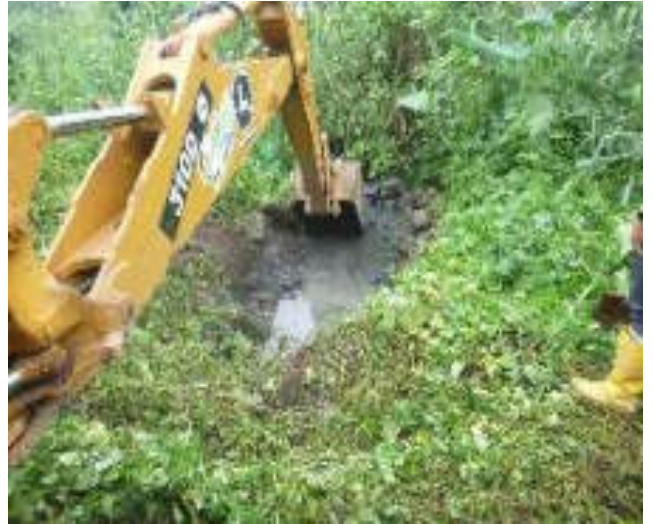
Febrero - 2018. Excavación para destapar alcantarillado sanitario obstruido. Calle: Digno Espinoza y 4 de Diciembre