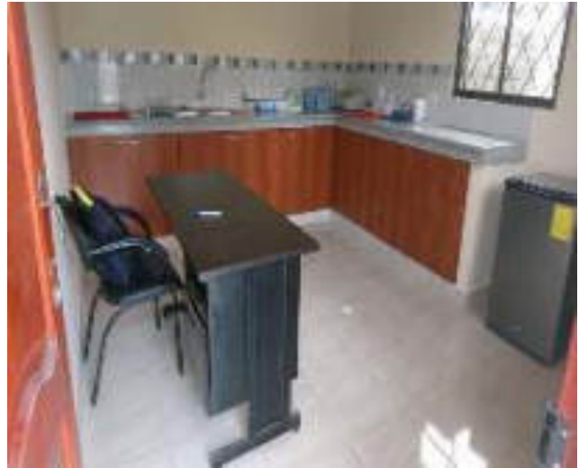
Laboratorio Terminado, Parte Interna