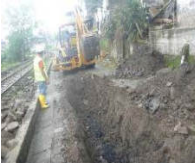
Enero - 2018. Excavación para cambio de tubería de alcantarillado sanitario colapsado, en la calle: Eloy Alfaro y 5 de Junio.