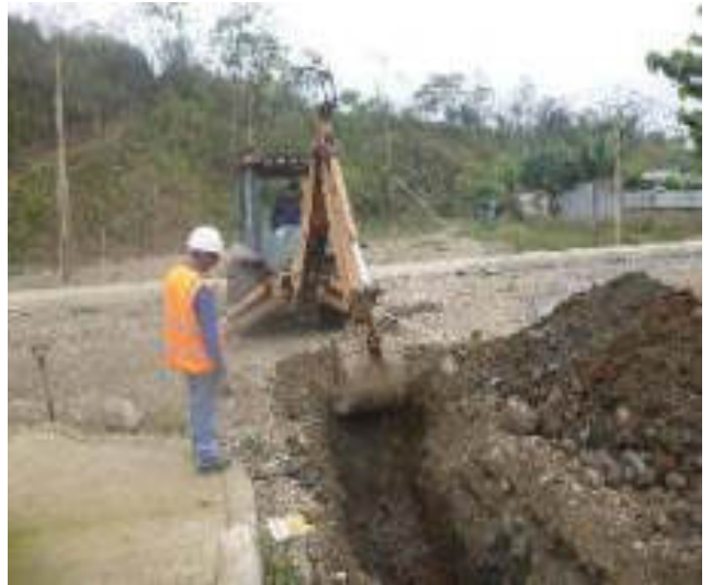
Noviembre 6 - 2018. Excavación para red matriz de Alcantarillado Sanitario. Calle: Rumiñahui entre M. Maquisaca y Pasaje 2.