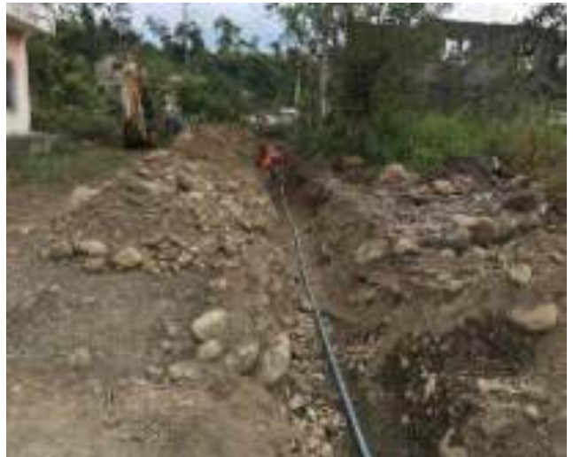
Julio - 2018. Excavación para extensión de red de agua potable. Calle: Gilberto Vicuña y Atahualpa