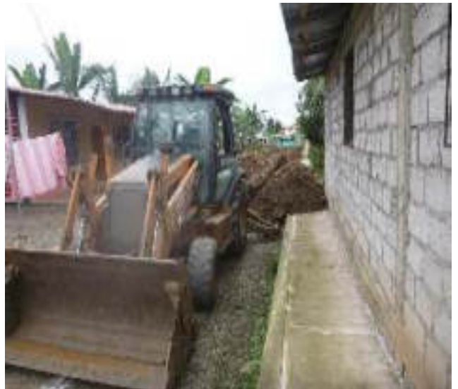
Noviembre 6 - 2018. Excavación para red matriz de Alcantarillado Sanitario. Calle: Rumiñahui entre M. Maquisaca y Pasaje 2.