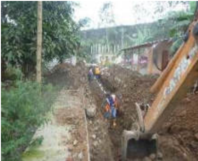
Noviembre 7 - 2018. Excavación para red matriz de Agua Potable y Alcantarillado Sanitario. Calle: Rumiñahui entre M. Maquisaca y Pasaje 2.