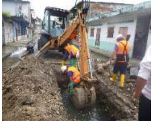
Marzo - 2018. Excavación para reparación de alcantarillado colapsado. En la calle Chimborazo y P. V. Maldonado