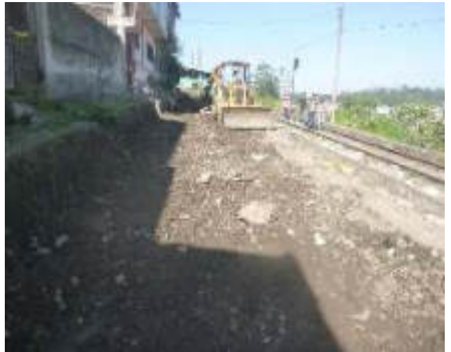
Enero - 2018. Excavación para cambio de tubería de alcantarillado sanitario colapsado, en la calle: Eloy Alfaro y 5 de Junio.