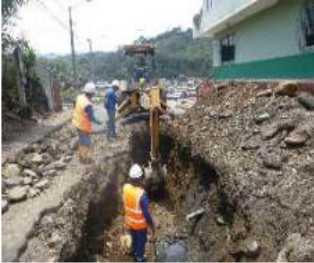
Septiembre 13 - 2018. Excavación para destapar alcantarillado colapsado, en la Calle: P.V. Maldonado y Simón Bolívar.