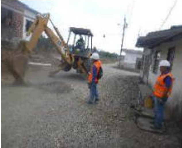
Agosto 30 - 2018. Excavación para destapar alcantarillado colapsado, en la Calle: 10 de Agosto y Baltazar Curillo.