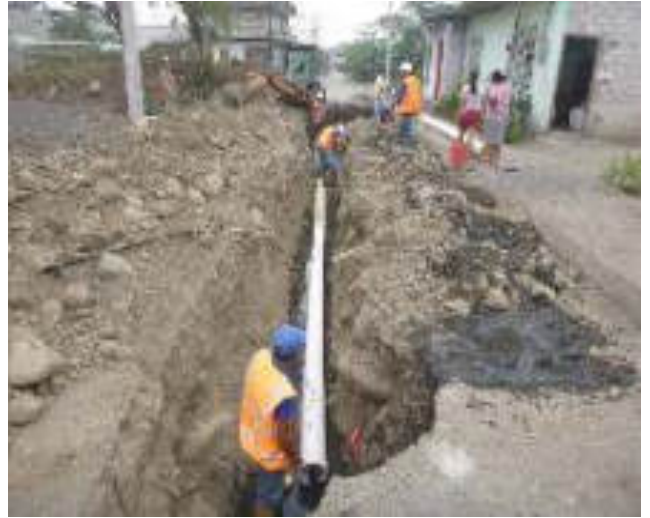
Septiembre 7 - 2018. Excavación para destapar alcantarillado colapsado, en la Calle: Atahualpa y Gilberto Vicuña