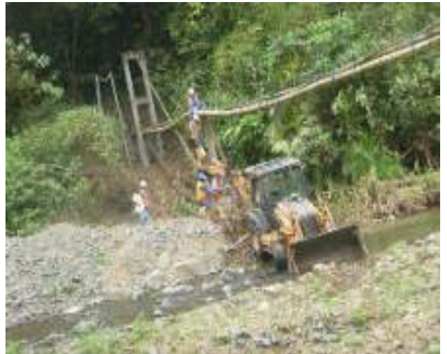
Septiembre 7 - 2018. Reforzar el paso elevado de tubería en el sector del rio Azul.