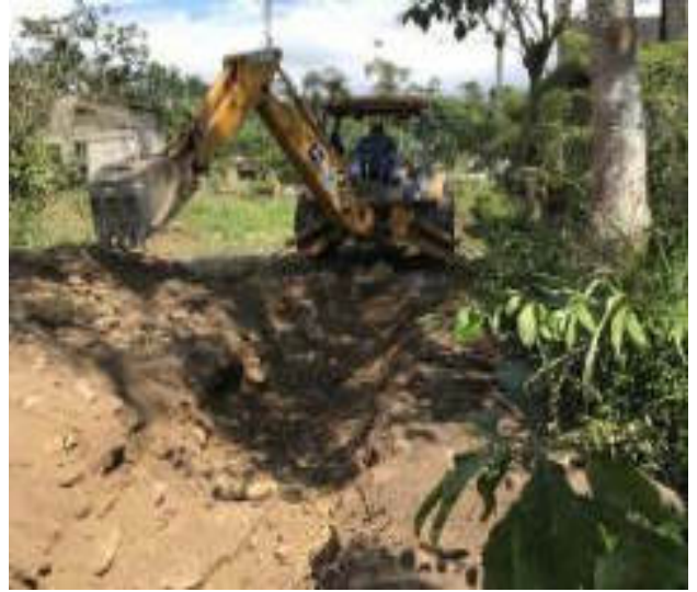
Julio - 2018. Excavación para extensión de red de agua potable. Calle: Gilberto Vicuña y Atahualpa