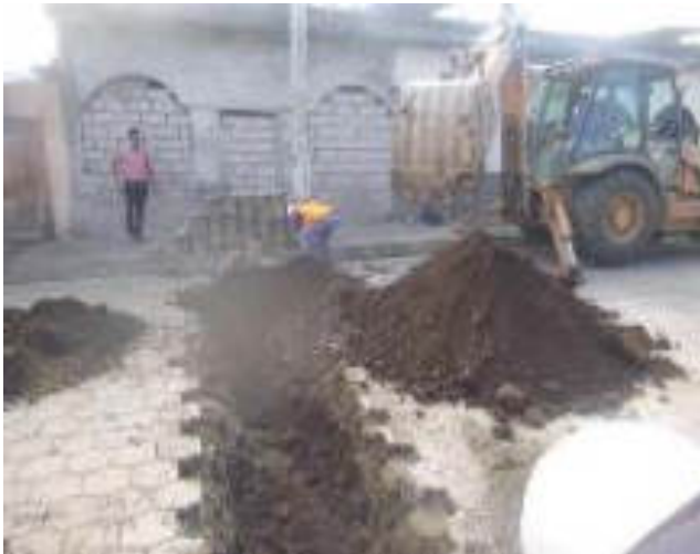
Agosto 23 - 2018. Excavación para guía nueva de Agua Potable, en la Calle: Riobamba y Jaime Cabrera.