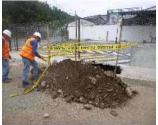
Agosto 23 - 2018. Excavación para guía nueva de alcantarillado sanitario, en la Calle: P. V. Maldonado y Cristóbal Colon.