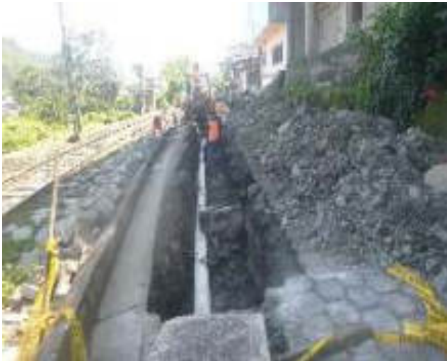
Enero - 2018. Excavación para cambio de tubería de alcantarillado sanitario colapsado, en la calle: Eloy Alfaro y 5 de Junio.