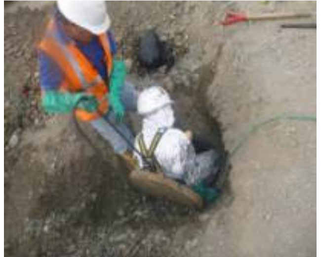
Octubre 25 - 2018. Limpieza de Pozos de Alcantarillado Sanitario: Barrio 9 de Diciembre.