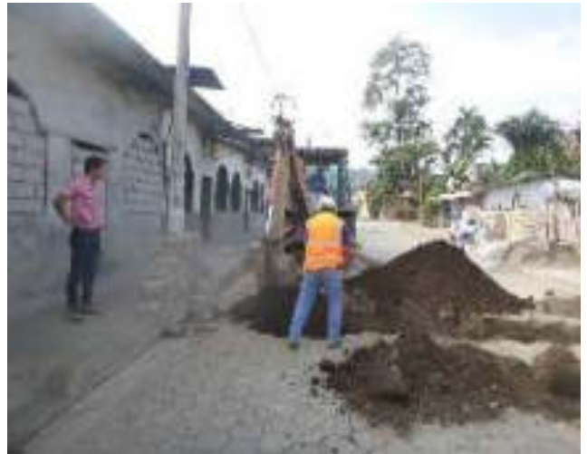
Agosto 23 - 2018. Excavación para guía nueva de Agua Potable, en la Calle: Riobamba y Jaime Cabrera.