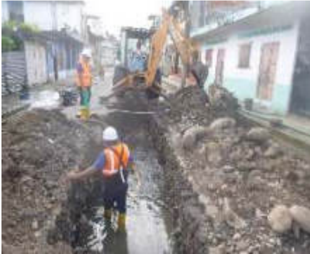
Marzo - 2018. Excavación para reparación de alcantarillado colapsado. En la calle Chimborazo y P. V. Maldonado