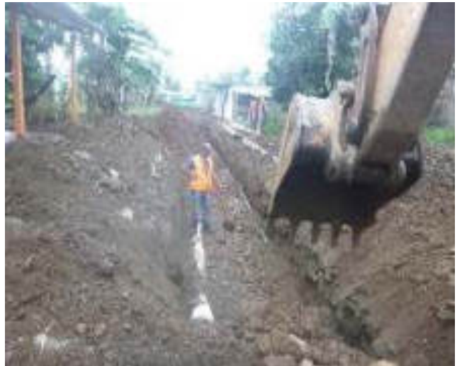
Noviembre 7 - 2018. Excavación para red matriz de Agua Potable y Alcantarillado Sanitario. Calle: Rumiñahui entre M. Maquisaca y Pasaje 2.