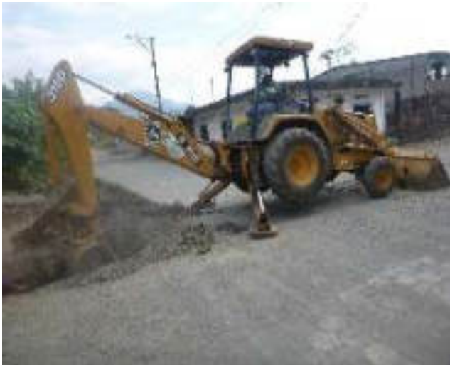
Agosto 30 - 2018. Excavación para destapar alcantarillado colapsado, en la Calle: Gómez Rendón y Baltazar Curillo.