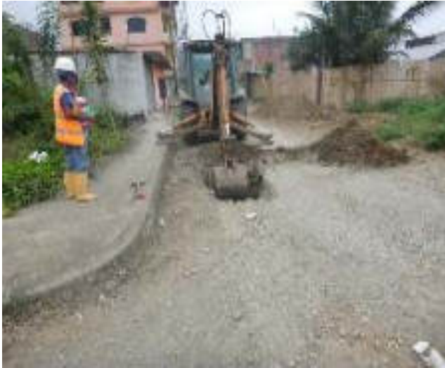
Octubre 29 - 2018. Excavación para destapar alcantarillado colapsado, en la Calle: Francisco Chávez y 5 de Junio.