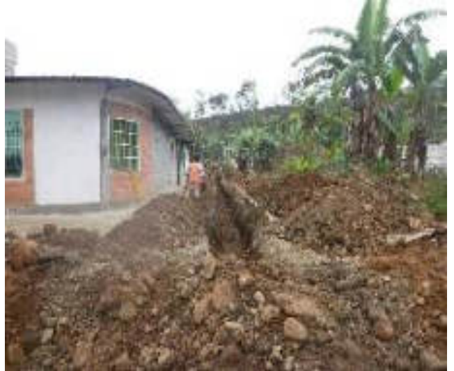
Noviembre 7 - 2018. Excavación para red matriz de Agua Potable y Alcantarillado Sanitario. Calle: Rumiñahui entre M. Maquisaca y Pasaje 2.