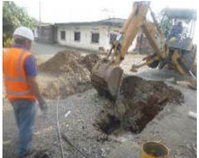
Agosto 30 - 2018. Excavación para destapar alcantarillado colapsado, en la Calle: Gómez Rendón y Baltazar Curillo.