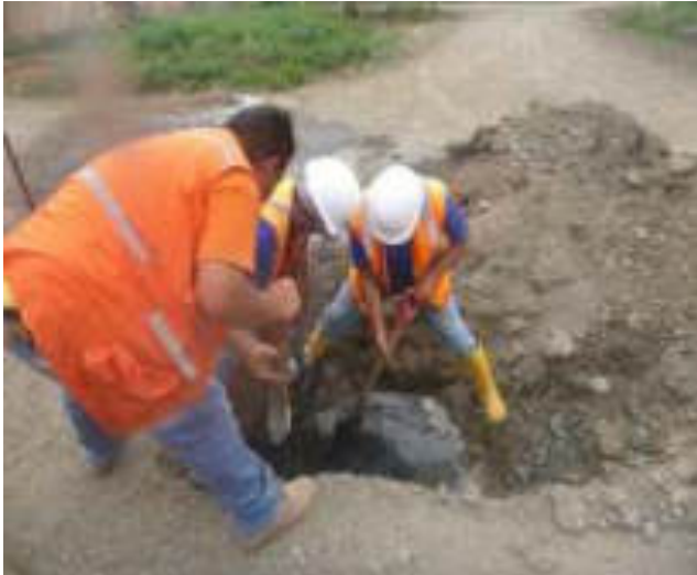
Octubre 25 - 2018. Limpieza de Pozos de Alcantarillado Sanitario: Barrio Los Andes.