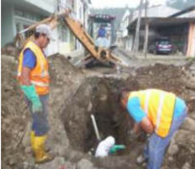
Diciembre 14 - 2018. Excavación para reparación de alcantarillado colapsado en la calle. Juan León Mera y Atahualpa.