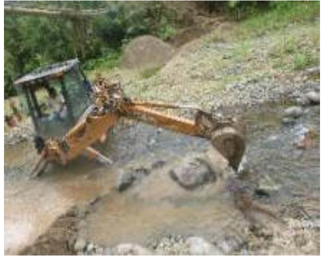
Septiembre 7 - 2018. Reforzar el paso elevado de tubería en el sector del rio Azul.