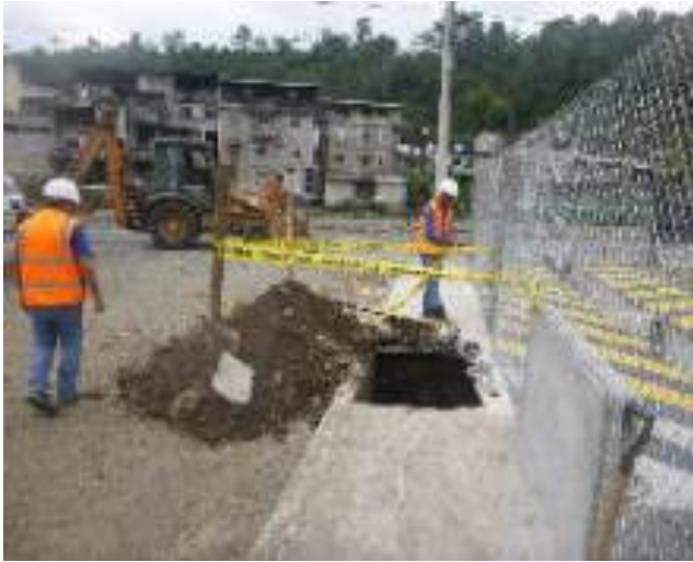
Agosto 23 - 2018. Excavación para guía nueva de alcantarillado sanitario, en la Calle: P. V. Maldonado y Cristóbal Colon.