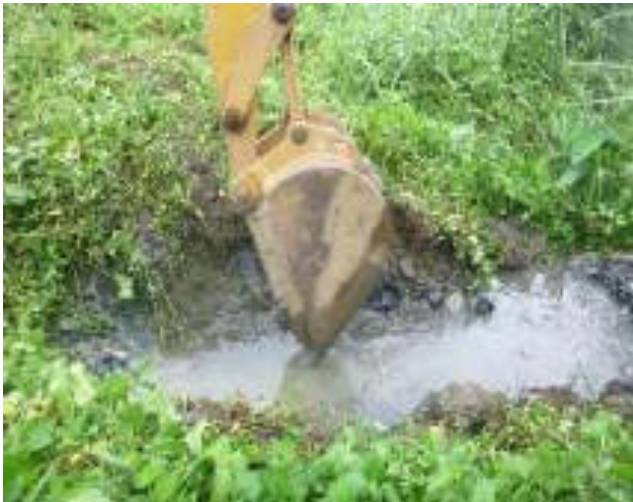
Febrero - 2018. Excavación para destapar alcantarillado sanitario obstruido. Calle: Digno Espinoza y 4 de Diciembre