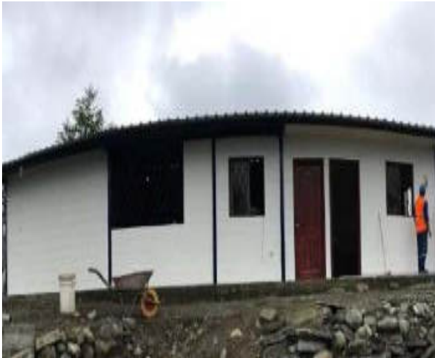
Bodega y Laboratorio de la EPMAPSAC