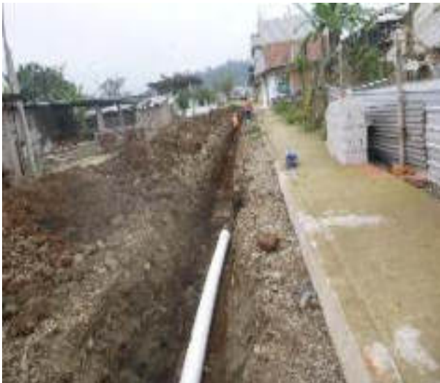
Noviembre 6 - 2018. Excavación para red matriz de Alcantarillado Sanitario. Calle: Rumiñahui entre M. Maquisaca y Pasaje 2.