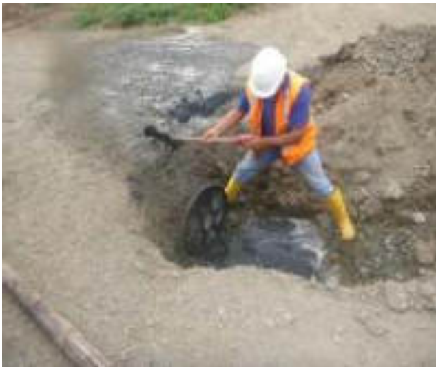
Octubre 25 - 2018. Limpieza de Pozos de Alcantarillado Sanitario: Barrio La Marina.