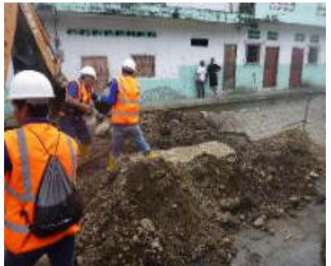
Marzo - 2018. Excavación para reparación de alcantarillado colapsado. En la calle Chimborazo y P. V. Maldonado