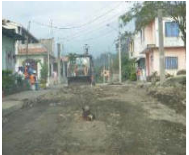
Septiembre 7 - 2018. Excavación para destapar alcantarillado colapsado, en la Calle: Atahualpa y Gilberto Vicuña