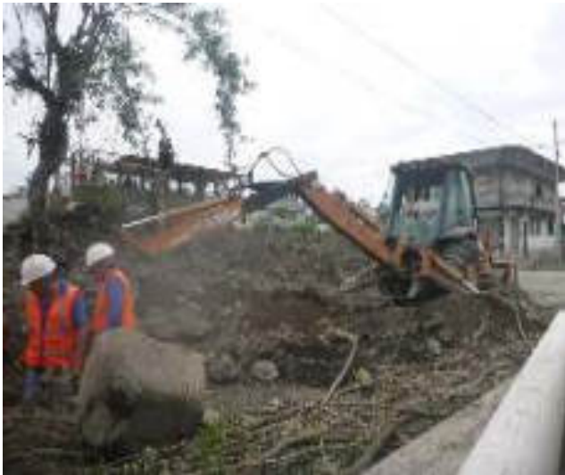
Septiembre 7 - 2018. Excavación para destapar alcantarillado colapsado, en la Calle: Atahualpa y Gilberto Vicuña