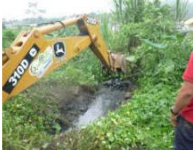
Febrero - 2018. Excavación para destapar alcantarillado sanitario obstruido. Calle: Digno Espinoza y 4 de Diciembre