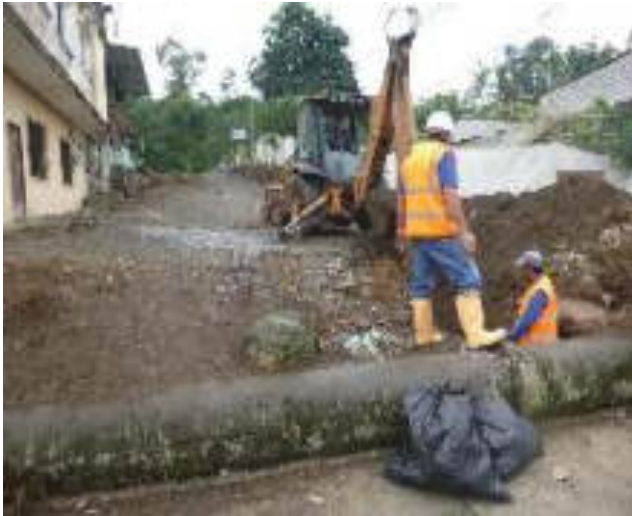
Julio - 2018. Excavación para extensión de red de agua potable. Calle Gilberto Vicuña entre Talud y 4 de Diciembre.