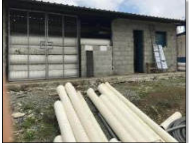
Construcción de Bodega y Laboratorio