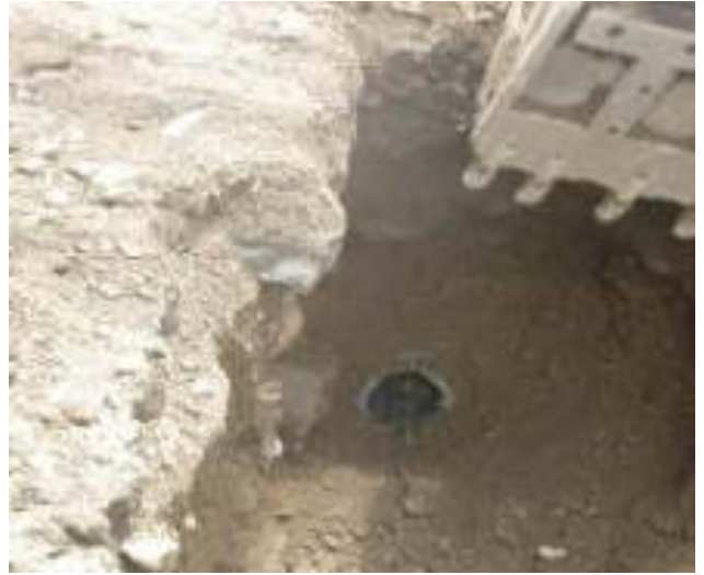
Septiembre 13 - 2018. Excavación para destapar alcantarillado colapsado, en la Calle: P.V. Maldonado y Simón Bolívar.