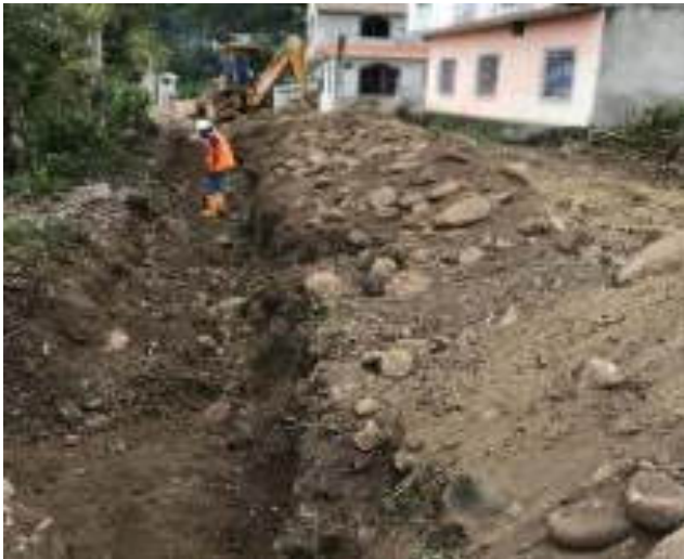
Julio - 2018. Excavación para extensión de red de agua potable. Calle: Gilberto Vicuña y Atahualpa