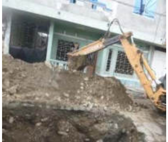
Diciembre 14 - 2018. Excavación para reparación de alcantarillado colapsado en la calle. Juan León Mera y Atahualpa.