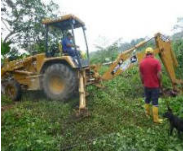
Febrero - 2018. Excavación para destapar alcantarillado sanitario obstruido. Calle: Digno Espinoza y 4 de Diciembre