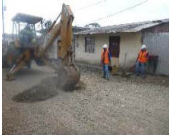
Agosto 30 - 2018. Excavación para destapar alcantarillado colapsado, en la Calle: 10 de Agosto y Baltazar Curillo.