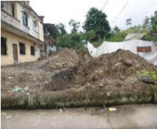
Julio - 2018. Excavación para extensión de red de agua potable. Calle Gilberto Vicuña entre Talud y 4 de Diciembre.