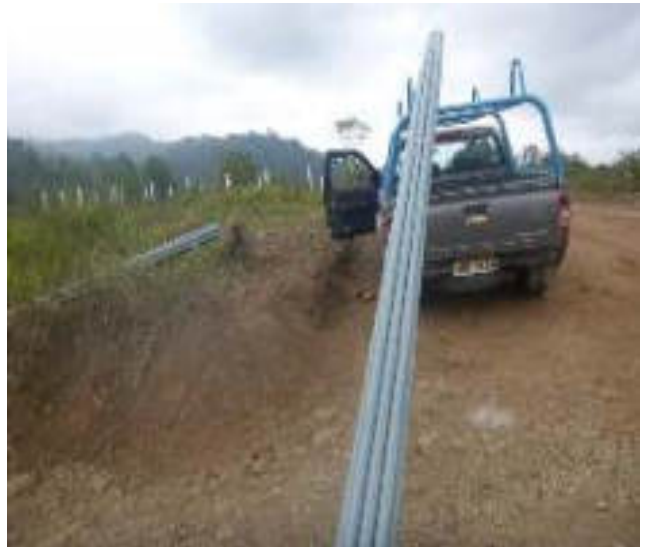
Noviembre 8 - 2018. Excavación para extensión de red matriz de Agua Potable en el sector de La Pampa.