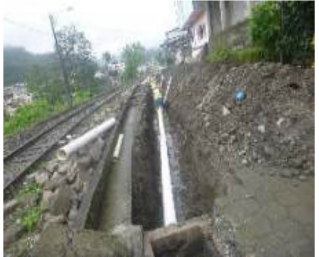
Enero - 2018. Excavación para cambio de tubería de alcantarillado sanitario colapsado, en la calle: Eloy Alfaro y 5 de Junio.