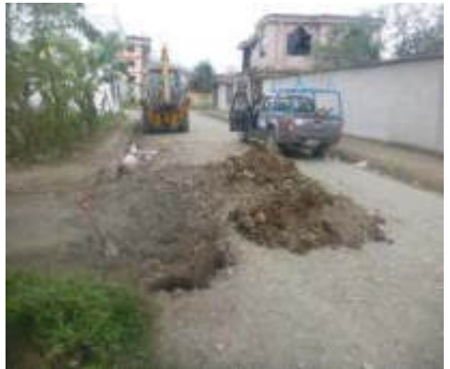
Octubre 25 - 2018. Limpieza de Pozos de Alcantarillado Sanitario: Barrio Víctor Corral Mantilla.