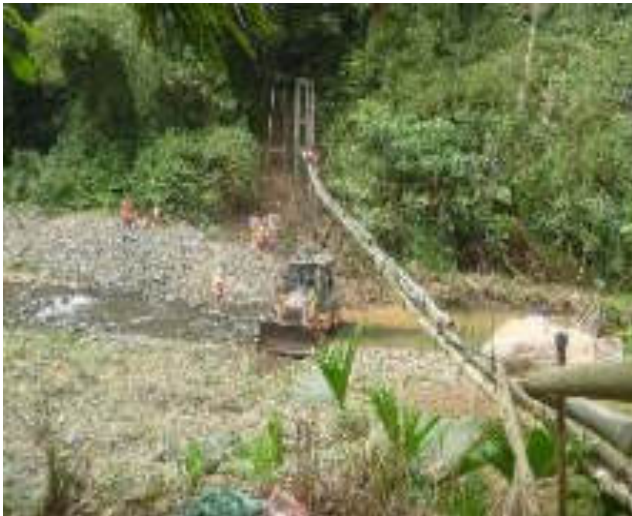
Septiembre 7 - 2018. Reforzar el paso elevado de tubería en el sector del rio Azul.