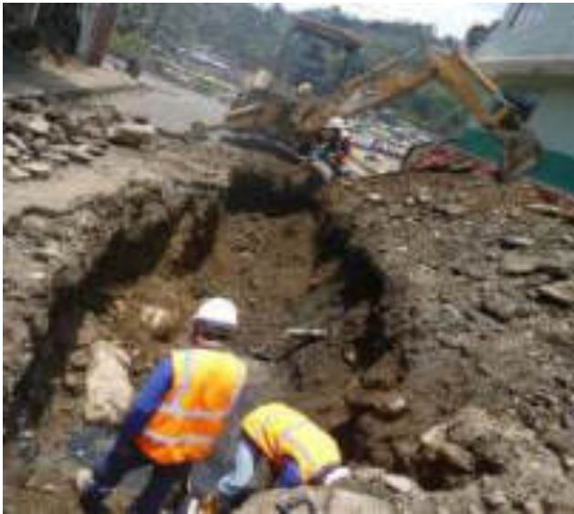
Septiembre 13 - 2018. Excavación para guía nueva de alcantarillado sanitario en la calle: 9 de Octubre y Eloy Alfaro.