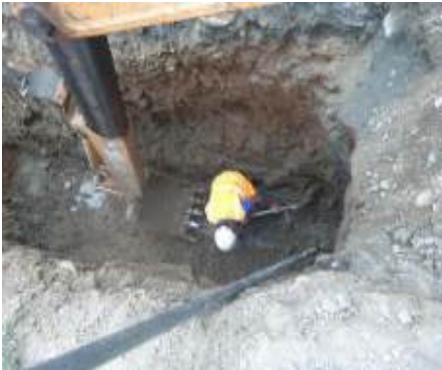
Octubre 29 - 2018. Excavación para destapar alcantarillado colapsado, en la Calle: Francisco Chávez y 5 de Junio.