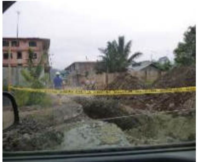
Octubre 29 - 2018. Excavación para destapar alcantarillado colapsado, en la Calle: Francisco Chávez y 5 de Junio.