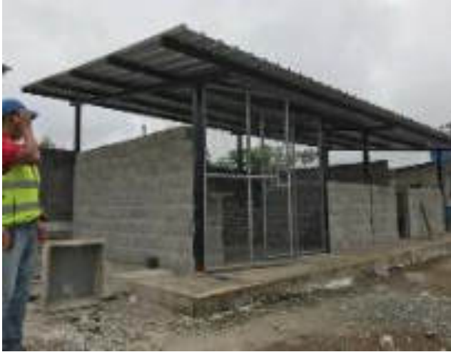
Construcción de Bodega y Laboratorio