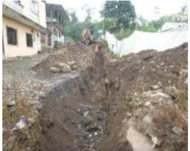
Julio - 2018. Excavación para extensión de red de agua potable. Calle Gilberto Vicuña entre Talud y 4 de Diciembre.