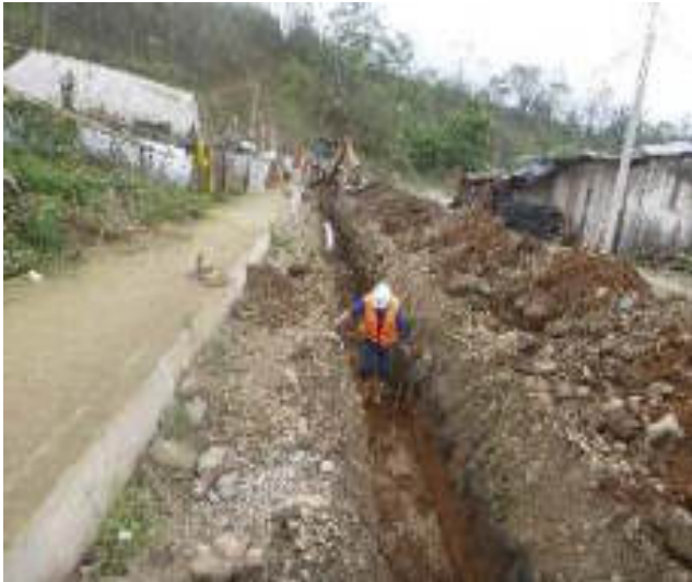
Noviembre 6 - 2018. Excavación para red matriz de Alcantarillado Sanitario. Calle: Rumiñahui entre M. Maquisaca y Pasaje 2.