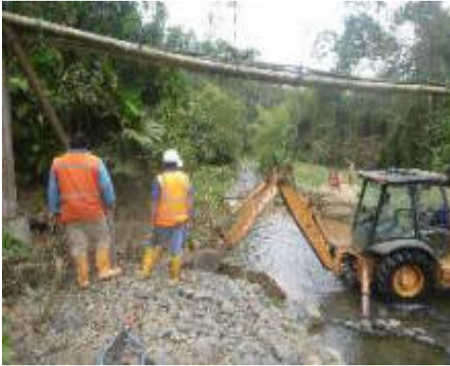
Septiembre 7 - 2018. Reforzar el paso elevado de tubería en el sector del rio Azul.