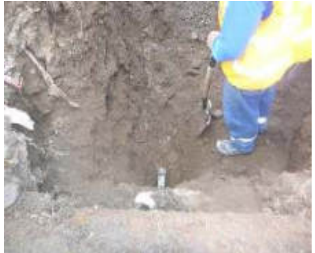
Julio - 2018. Excavación para extensión de red de agua potable. Calle Gilberto Vicuña entre Talud y 4 de Diciembre.