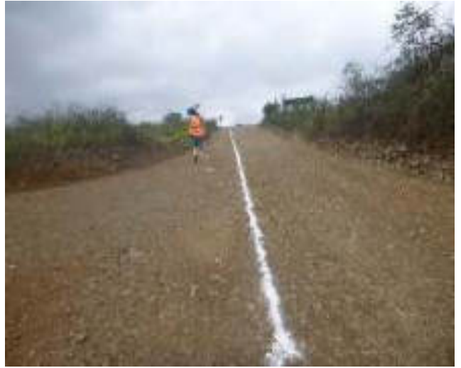
Noviembre 8 - 2018. Excavación para extensión de red matriz de Agua Potable en el sector de La Pampa.