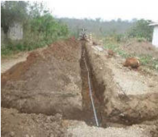
Noviembre 8 - 2018. Excavación para extensión de red matriz de Agua Potable en el sector de La Pampa.