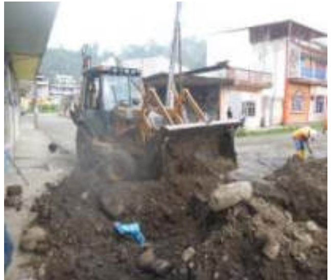
Diciembre 14 - 2018. Excavación para reparación de alcantarillado colapsado en la calle. Juan León Mera y Atahualpa.