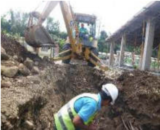
Enero - 2018. Excavación para extensión de red de agua potable calle: Martin Ortega entre 4 de Diciembre y Eloy Chicaiza.