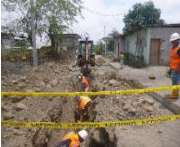
Septiembre 7 - 2018. Excavación para destapar alcantarillado colapsado, en la Calle: Atahualpa y Gilberto Vicuña