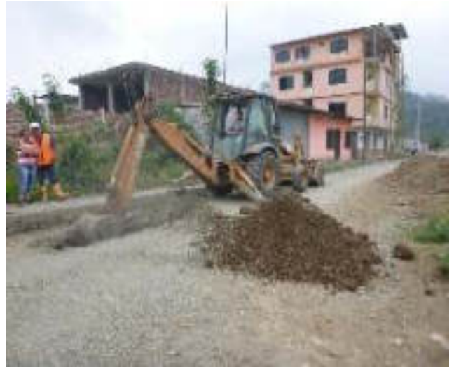
Octubre 29 - 2018. Excavación para destapar alcantarillado colapsado, en la Calle: Francisco Chávez y 5 de Junio.