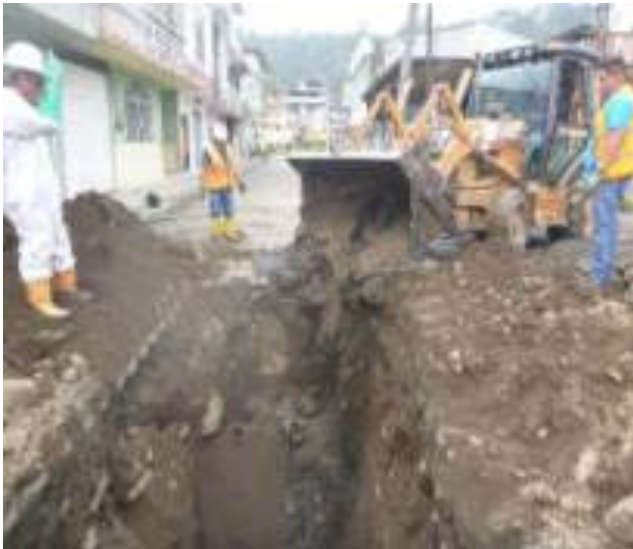
Diciembre 14 - 2018. Excavación para reparación de alcantarillado colapsado en la calle. Juan León Mera y Atahualpa.