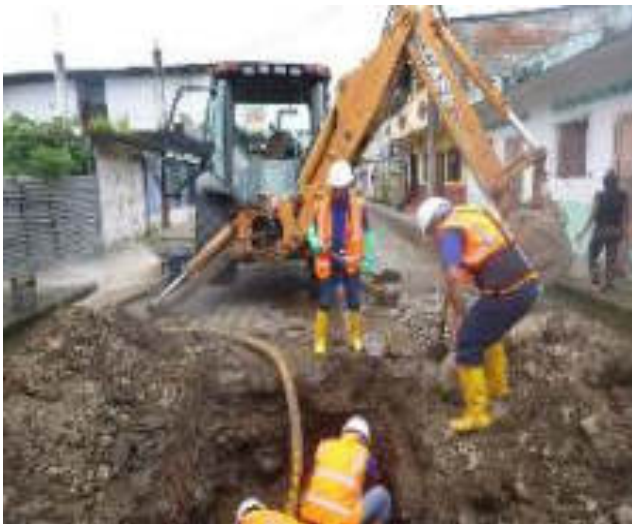
Marzo - 2018. Excavación para reparación de alcantarillado colapsado. En la calle Chimborazo y P. V. Maldonado